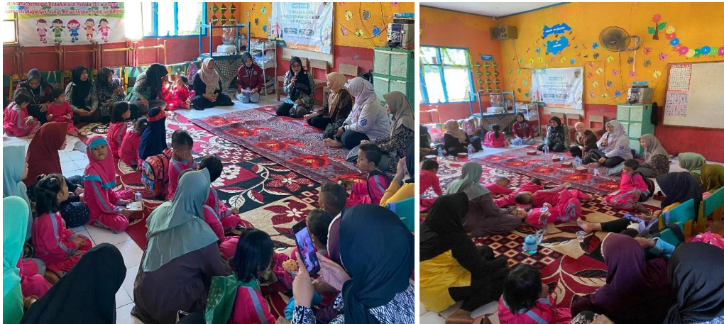
Gambar 2. Pelaksanaan Kegiatan

anak selama masa tersebut seperti pentingnya untuk menanamkan rasa aman pada anak saat berada di Lembaga PAUD, mendorong peran aktif orang tua dalam menciptakan suasana belajar yang menyenangkan di sekolah, serta mengoptimalkan tumbuh kembang anak melalui kolaborasi yang erat antara guru dan orang tua. Melalui kegiatan sosialisasi ini, diharapkan seluruh pihak memiliki pemahaman yang sama dan dapat memberikan dukungan optimal dalam pelaksanaan program pengabdian, sehingga anak-anak lebih siap dan nyaman menjalani aktivitas pembelajaran