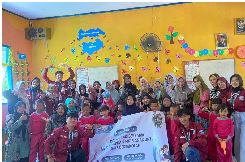
Gambar 4. Foto Bersama Setelah Kegiatan Sosialisasi

Hasil Pengabdian menunjukkan peningkatan kemampuan yang bisa dilihat dari hasil pretest dan postest yang ditunjukkan dalam grafik di bawah ini, yang terlihat hasilnya