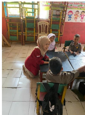
Gambar 1. Kelompok KKM 70 Saat membantu mengajar dan observasi di KOBER Al-Firdaus

Metode pengabdian ini terdiri dari beberapa tahapan mulai dari identifikasi masalah, perencanaan program, pelaksanaan kegiatan, hingga evaluasi hasil. Selama kurang lebih dua minggu pelaksanaan kegiatan Kuliah Kerja Mahasiswa (KKM) di KOBER Al-Firdaus, mahasiswa melakukan observasi dan turut serta dalam kegiatan pembelajaran. Dari hasil pengamatan tersebut ditemukan beberapa permasalahan yang muncul pada anak didik baru, khususnya kelompok A. Beberapa anak tampak masih mengalami kesulitan dalam proses adaptasi di lingkungan prasekolah. Hal ini ditunjukkan dengan adanya anak yang sulit berpisah dengan orang tua saat ditinggalkan di sekolah, serta munculnya gejala emosional seperti menangis berkepanjangan, enggan masuk kelas, atau menunjukkan perilaku menolak kegiatan. Selain itu, sebagian anak juga masih terlihat kesulitan dalam mengelola emosi ketika berhadapan dengan situasi baru, teman sebaya, maupun tuntutan rutinitas sekolah.