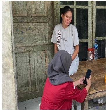
Gambar 3. Mahasiswa membantu para orang tua mengisi quisioner pretest dan postest

Hasil Pengabdian menunjukkan peningkatan kemampuan yang bisa dilihat dari hasil pretest dan postest yang ditunjukkan dalam grafik di bawah ini, yang terlihat hasilnya