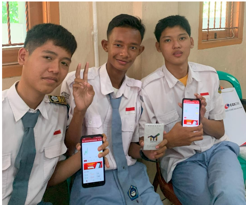
Gambar 4. Para peserta sedang memantau pergerakan harga saham secara real-time .

Selain itu, observasi selama kegiatan menunjukkan bahwa siswa lebih mudah memahami konsep pasar modal ketika disertai visualisasi pergerakan