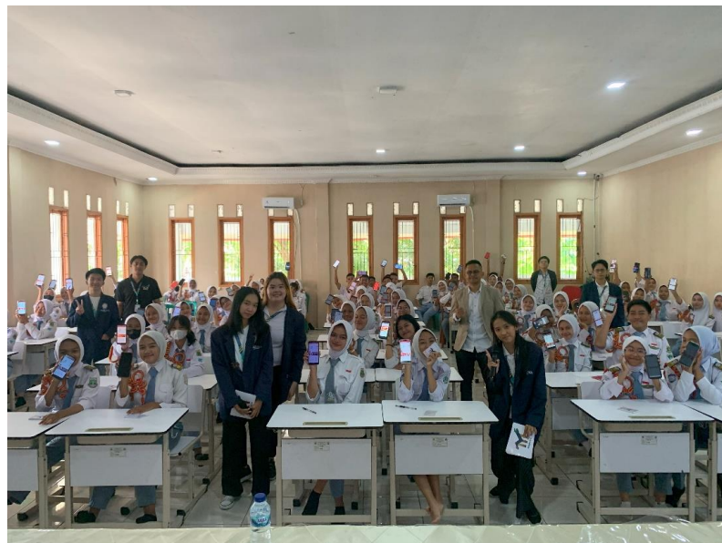
Gambar 2. Para peserta sedang menggunakan aplikasi virtual trading

Kegiatan ini dihadiri oleh kepala sekolah, guru pendamping, dan 110 siswa kelas XII dari SMKN 5 Kab. Tangerang. Para peserta kegiatan sangat antusias dalam mengikuti seluruh rangkaian kegiatan sesuai dengan perjanjian dengan pihak sekolah.