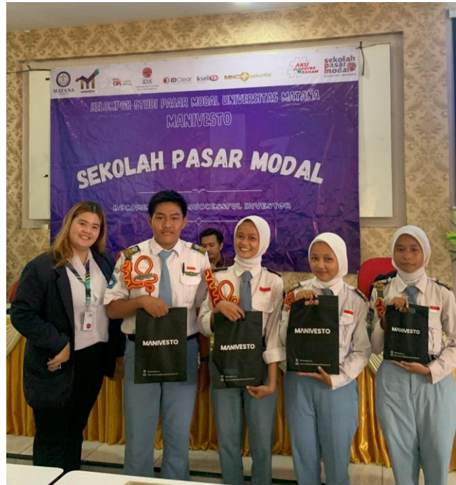
Gambar 4. Dokumentasi pemberian merchandise kepada peserta terpilih.

Partisipasi aktif peserta juga terlihat dalam sesi kuis interaktif yang menanyakan berbagai kode saham dan jenis instrumen pasar modal. Beberapa siswa berhasil menjawab pertanyaan dengan benar dan mendapatkan hadiah dalam bentuk uang tunai, saham, dan merchandise sebagai bentuk apresiasi. Hal ini memperkuat temuan Rifani & Nurhidayat (2024), yang menekankan bahwa pengalaman langsung dalam simulasi dapat membentuk sikap kritis dan reflektif terhadap risiko investasi.