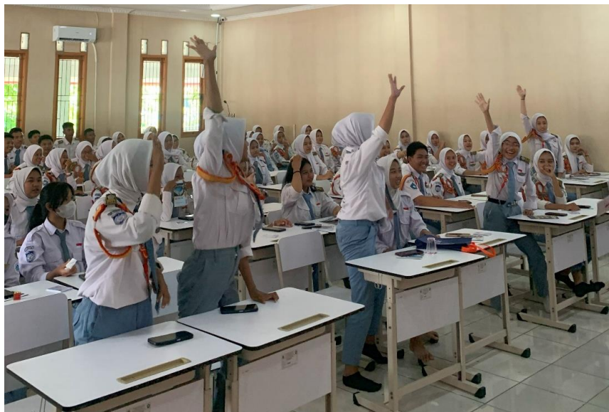
Gambar 4. Antusiasme para peserta dalam bertanya dan menjawab kuis

Secara kualitatif, antusiasme peserta tercermin dari banyaknya siswa yang mengajukan pertanyaan selama sesi diskusi. Banyak pertanyaan yang diajukan peserta, mulai dari mekanisme penentuan harga saham, risiko investasi, hingga legalitas penyedia layanan. Bahkan beberapa siswa sudah mengunduh aplikasi MotionTrade dan mengikuti seluruh proses pembukaan akun riil dengan pendampingan dari tim pelaksana. Temuan ini selaras dengan hasil pengabdian sebelumnya yang menyebutkan bahwa edukasi finansial sejak usia sekolah mampu membentuk pola pikir rasional dalam mengambil keputusan keuangan (Tirtayani & Wibowo, 2020; Solicha & Naim, 2025).