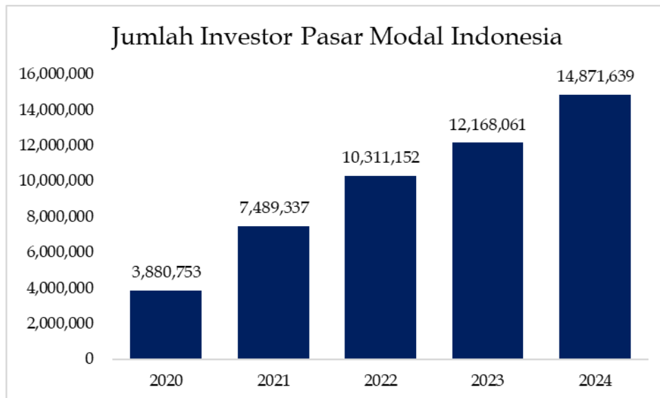
Gambar 1. Jumlah investor pasar modal Indonesia

Di sisi lain, data dari Kustodian Sentral Efek Indonesia (KSEI) menyebutkan bahwa jumlah investor pasar modal terus meningkat, mencapai 14,87 juta pada akhir 2024. Lebih dari 60% investor tersebut berasal dari kelompok usia di bawah 30 tahun. Kenaikan jumlah investor muda ini menunjukkan adanya minat yang besar, namun belum diimbangi dengan pemahaman yang memadai. Penelitian terdahulu mengonfirmasi bahwa sebagian besar investor muda belum sepenuhnya memahami risiko investasi dan cenderung mengikuti tren tanpa pertimbangan rasional (Putri & Hudaya, 2024).