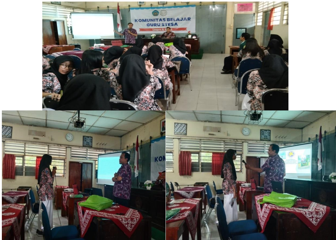
Gambar 2. Ceramah dan Diskusi Interaktif

Kegiatan penyuluhan memiliki fungsi yang cukup penting dalam memberikan pengetahuan yang dibutuhkan untuk mengirimkan suatu informasi dan edukasi. penyuluhan menggunakan kombinasi ceramah dan diskusi kasus digunakan untuk meningkatkan pengetahuan dan pemahaman siswa mengenai aborsi dan konsekuensi hukum tindak pidana aborsi. Dengan penyuluhan yang efektif dapat mempengaruhi pengetahuan, pemahaman, dan kesadaran individu, kelompok atau suatu masyarakat.