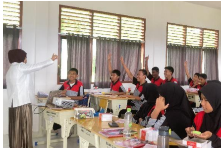
Gambar 2. Sesi tanya jawab

kepada peserta yang sudah berani memberikan jawaban dari pertanyaan yang diberikan oleh Mahasiswa Apoteker XIII mengenai sosialisasi yang telah dibawakan.