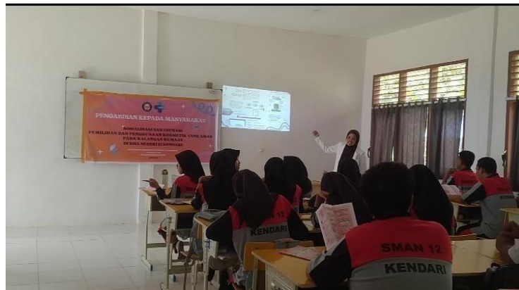
Gambar 1. Penyampaian Materi oleh mahasiswa Apoteker XIII

Kegiatan pengabdian ini dimulai dengan mengumpulkan siswa-siswi di dalam kelas 10 III yang berjumlah 31, setelah siswa siswi terkumpul maka kami melakukan pembukaan dengan perkenalan dan menayakan hal mengenai kosmetik dan pemberian kuesioner pretest untuk mengetahui seberapa jauh pemahaman siswa siswi SMA Negeri 12 Kendari mengenai pemilihan dan penggunaan kosmetik yang aman digunakan. Selanjutnya pemaparan materi dan pemberian leaflet tentang pemilihan dan penggunaan produk kosmetika yang aman, dan dilanjutkan dengan himbauan untuk melakukan pengecekan "KLIK" (Kemasan, Label, Izin edar dan Kadaluarsa) pada produk kosmetik yang menjadi pilihan untuk digunakan.