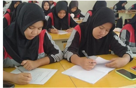
Gambar 3. Pengisian kuesioner

Berdasarkan kuesioner yang diberikan oleh Penyuluh, menunjukkan respon siswa siswi terhadap kegiatan yang dilakukan serta dapat dilihat adanya peningkatan pemahaman siswa siswi sebelum dan setelah pemberiaan materi yang mendapatkan nilai rata-rata sangat baik.