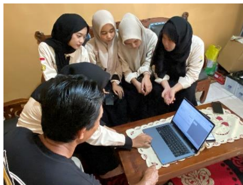
Gambar 3. Dokumentasi Kegiatan