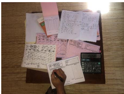
Gambar 1. Pencatatan Laporan Keuangan Secara Manual

Bagian terakhir dari pelatihan berfokus pada penyusunan laporan keuangan secara mandiri. Peserta diajak mensimulasikan pembuatan laporan laba rugi dan laporan kas bulanan berdasarkan data yang telah dicatat. Pemilik dan admin usaha kemudian dilatih untuk menyusun rekap transaksi bulanan, yang berfungsi sebagai alat evaluasi performa usaha dan dasar dalam pengambilan keputusan strategis. Setelah pelatihan berlangsung, pemilik usaha mengakui bahwa pencatatan digital sangat membantu dalam menyusun laporan keuangan yang lebih profesional dan mudah dipahami. Sistem ini juga terbukti mempermudah proses pelaporan kepada mitra perusahaan, terutama karena bengkel secara rutin melakukan penagihan invoice setiap akhir bulan.