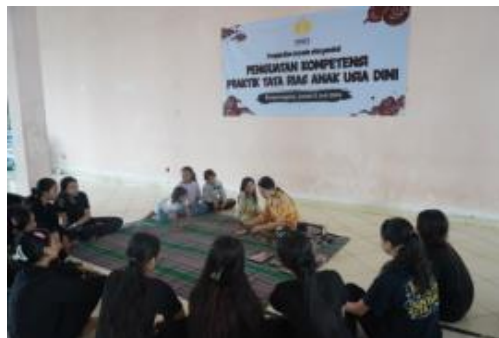
Gambar 2. Penyampaian materi

Pada pelaksanaan kegiatan diisi dengan pemberian materi menggunakan metode ceramah dan demonstrasi. Materi yang diberikan berupa materi dasar praktik tata rias anak usia dini. Pelatihan diawali dengan materi pengetahuan make up, alat-alat yang digunakan untuk praktik tata rias, cara memilih make up yang baik dan aman untuk anak, hingga praktik tata rias anak usia dini.