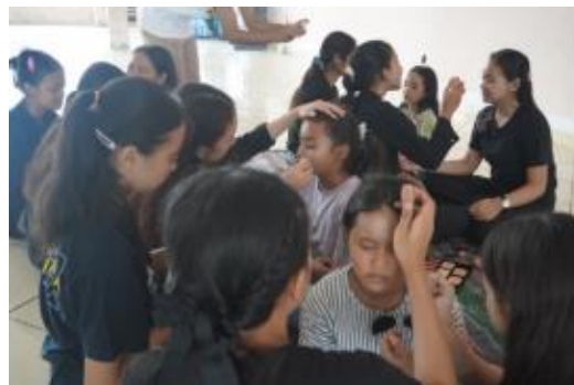
Gambar 3. Praktik tata rias

Setelah pemberian materi, peserta melaksanakan praktik merias anak usia dini menggunakan alat dan bahan yang sudah disediakan. Kegiatan praktik ini sekaligus menjadi pembimbingan kepada peserta terhadap praktik rias anak usia dini.