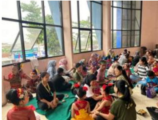
Gambar 4. Monitoring

Tahap monitoring dilakukan setelah kegiatan pengabdian selesai dilaksanakan. Pada tahap ini dilaksanakan, guna memantau hasil dari kegiatan pengabdian dan penerapan rencana tindak lanjut. Hasil monitoring yang dilaksanakan, peserta pengabdian mampu untuk menerapkan praktik dan ilmu yang diperoleh pada saat pengabdian serta mengimplementasikannya di kegiatan sanggar. Berikut merupakan bukti implementasi dari kegiatan pengabdian yang dilaksanakan, para pendidik sanggar mampu untuk praktik secara langsung merias anak didiknya pada saat kegiatan lomba yang diikuti oleh sanggar.