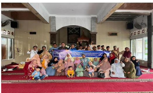
Gambar 4. Foto Bersama Tim PKM UMA, Pengurus BKM, Masyarakat dan Mahasiswa