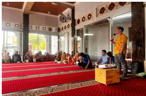
Gambar 2. Menyampaikan dan Pemaparan materi dari Tim Penyuluh

Karena permasalahan masyarakat diatas dengan kehadiran tim penyuluh ke Mesjid Ar- Rahman Dusun X Desa Medan Krio memberikan edukasi hukum sehingga banyak masyarakat yang bertanya kepada tim penyuluh mengenai kejahatan geng motor pada kalangan remaja. Edukasi yang diberikan oleh tim penyuluh kepada mitra antara lain menjelaskan pada masyarakat akan kejahatan geng motor yang sedang terend saat ini yang banyak melibatkan anak remaja dan memberikan solusi untuk melakukan pencegahan terlibatnya anak remaja masuk kelompok geng motor supaya dapat membantu masyarakat Mesjid Ar-Rahman Dusun X desa Medan Krio dalam memberikan pemahaman melakukan pencegahannya. Permasalahan yang akan diangkat dalam pengabdian kepada masyarakat ini adalah bagaimana pengaturan hukum dan upaya pencegahan dan sanksi pidana terhadap pelaku kejahatan geng motor pada kalangan remaja di Indonesia.