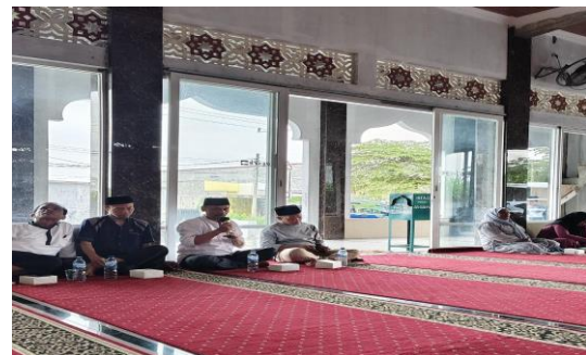
Gambar 3. Diskusi dan Tanya Jawab