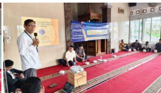
Gambar 5. Foto Bersama Tim PKM UMA, Pengurus BKM, Masyarakat dan Mahasiswa