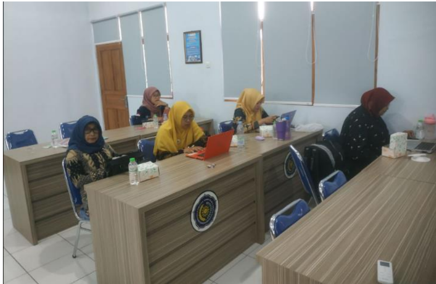
Gambar 1. Peserta Workshop mengikuti acara

Pretest yang diberikan sebelum pelatihan menunjukkan bahwa sebagian besar peserta telah memiliki pemahaman awal yang cukup tentang konsep dasar publikasi ilmiah bereputasi. Namun, masih ditemukan beberapa kelemahan terutama dalam membedakan antara struktur artikel ilmiah dan karya tulis akademik biasa, serta memahami pentingnya literature review dan proses peer-review .