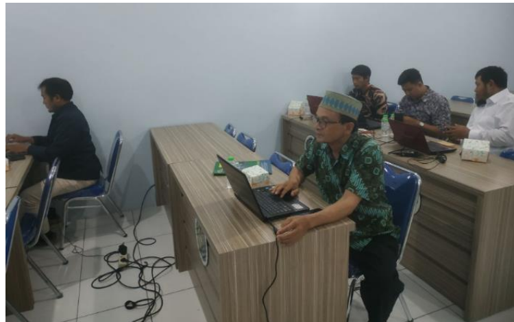
Gambar 2. Peserta Workshop mengerjakan draf artikel

Sesi praktik dan diskusi kelompok selama workshop menjadi ruang reflektif bagi peserta untuk mengungkapkan kesulitan yang dihadapi dalam menyusun artikel ilmiah (Dosinaeng et al., 2025). Salah satu hambatan utama yang muncul adalah minimnya pengalaman menyusun artikel dengan gaya dan struktur khas jurnal bereputasi. Banyak peserta yang terbiasa menulis skripsi atau laporan akademik internal, namun belum akrab dengan pola penulisan yang ringkas, logis, dan terstruktur sebagaimana dituntut dalam artikel ilmiah yang layak publikasi (Adirasa, 2021).