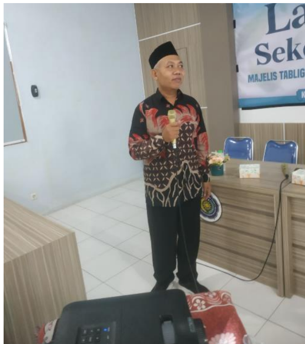
Gambar 4. Narasumber memberikan penjelasan submit

Manfaat yang dirasakan peserta workshop tidak hanya mencakup peningkatan pemahaman konseptual tentang publikasi ilmiah, tetapi juga menyentuh dimensi afektif seperti rasa percaya diri, keberanian mencoba, dan kemauan untuk memulai proses menulis (Surya, 2010). Dalam sesi refleksi akhir dan isian post-test , banyak peserta menyampaikan bahwa mereka merasa lebih siap dan berani menulis setelah mengikuti simulasi submission dan mendapatkan umpan balik dari mentor.