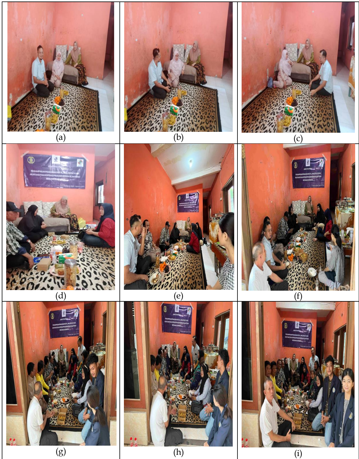
Gambar 2. Foto-Foto Kegiatan PKM Koperasi Produsen Berkah Sejahtera Bersama