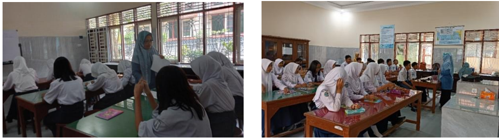
Gambar 1. Kegiatan Pengabdian Pertemuan Pertama

memungkinkan terciptanya interaksi dua arah antara tim pengabdian dan peserta. Penggunaan bahan kimia dalam praktikum yang tidak bertanggung jawab dan membuang limbah maupun sisa bahan ke lingkungan dapat membahayakan makhluk hidup dan lingkungan. Peserta, dalam hal ini siswa dan guru, sebagai pelaku utama praktikum IPA juga dapat terkena bahaya yang ditimbulkan dari penggunaan bahan kimia. Oleh karena itu, siswa dan guru harus paham terhadap penggunaan bahan kimia dalam praktikum IPA (Redhana, 2017). Peserta menunjukkan antusiasme selama diskusi. Mereka juga bersemangat dalam menyampaikan pandangan serta persepsi. Dokumentasi kegiatan pada pertemuan pertama dapat dilihat pada Gambar 1.