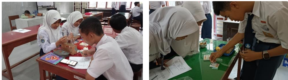
Gambar 2. Kegiatan Pengabdian Pertemuan Kedua

Pertemuan ketiga dilaksanakan pada hari Jumat tanggal 20 September 2024. Kegiatan yang dilaksanakan dipertemuan ketiga yaitu presentasi kelompok, postes, dan evaluasi kegiatan pengabdian oleh peserta. Dokumentasi pertemuan ketiga ditunjukkan pada Gambar 3. Peserta telah mempraktikkan keterampilan proses sains melalui praktikum pengujian kualitas sumber mata air pada pertemuan kedua. Setelah praktikum, peserta diminta mendiskusikan hasil yang telah mereka peroleh dan memaparkannya di depan kelas. Peserta yang tidak mempresentasikan hasil diminta untuk menanggapi pemaparan kelompok lain. Peserta selanjutnya mengerjakan postes untuk mengukur keterampilan proses sains yang telah dilatih melalui kegiatan praktikum dan diskusi.