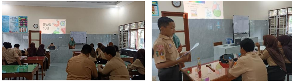
Gambar 3. Kegiatan Pengabdian Pertemuan Ketiga

Rata-rata skor postes keterampilan proses sains peserta adalah 82, yang termasuk dalam kategori tinggi. Skor postes menunjukkan bahwa keterampilan proses sains peserta mengalami peningkatan setelah dilakukan pengabdian. Sementara itu, rata-rata postes untuk setiap indikator keterampilan proses sains ditampilkan pada Tabel 4.