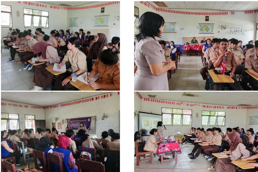
Gambar 3. Kegiatan Edukasi Anti Kekerasan di SMA Purnama