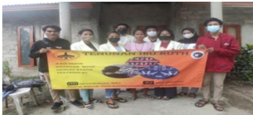
Gambar 4. Spanduk kegiatan usaha tenun ikat