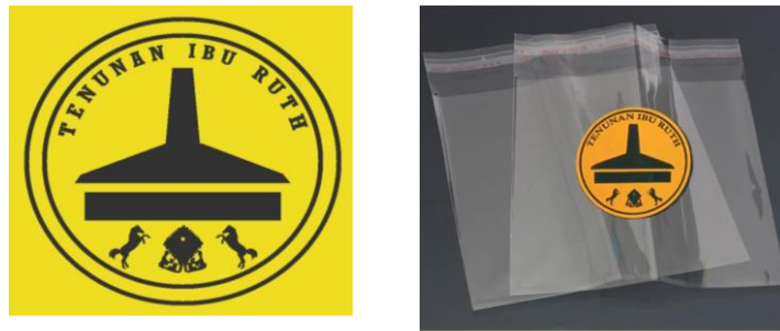
Gambar 3. Logo dan Kemasan usaha tenun ikat

kemasan menggunakan bahan plastik agar karena ketersediaan bahan baku yang cukup banyak di daerah waingapu.