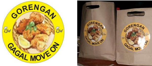
Gambar 1. Logo dan Kemasan Gorengan

Dalam pelaksanaan sosialisasi juga diakhiri dengan pemberian spanduk untuk membantu mempromosikan usaha tersebut.