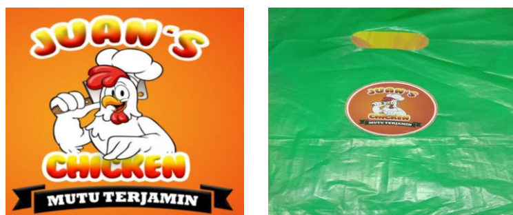
Gambar 5. Logo dan kemasan produk Juan'S Chicken

Logo yang dihasilkan dibuat dengan lebih menonjolkan elemen ilustrasinya untuk memberi kesan sebagai brand karakter dalam usaha ini, kemudian dikombinasikan dengan tipografi yang unik dan warna jingga sebagai warna dasar. Kemasan yang digunakan berbahan plastik agar tetap menjaga kualitas produk dari daging ayam.