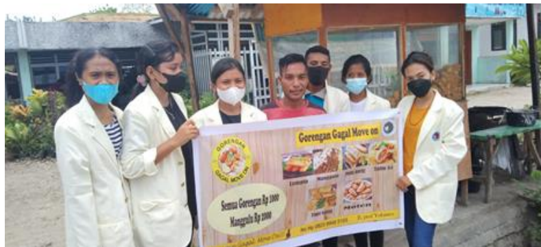
Gambar 2. Spanduk kegiatan

Dalam pelaksanaan sosialisasi juga diakhiri dengan pemberian spanduk untuk membantu mempromosikan usaha tersebut.