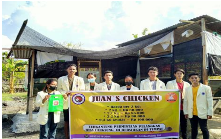
Gambar 6. Spanduk Sosialisasi usaha Juan’S Chicken

Pelaksanaan kegiatan Pengabdian kepada Masyarakat yang dilakukan pada 3 UMKM tersebut berjalan dengan baik. Pelaksanaan kegiatan ini akan terus dilakukan dan dikembangkan lebih luas untuk pengembangan UMKM di pulau. Logo dari 3 UMKM telah diproses dalam pendaftaran Hak Cipta sehingga dapat dikembangkan menjadi brand lokal.