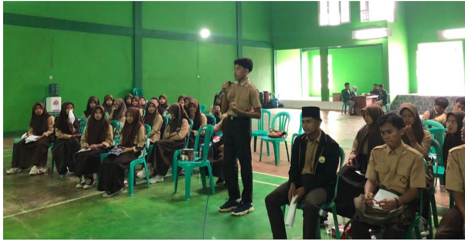
Gambar 5. Proses Sharing dan Diskusi Pada Kegiatan Seminar Motivation Educational Training

Berdasarkan hasil observasi dan wawancara muncul dan berkembang kalimat dan/atau pemikiran ditengah masyarakat “ lah nyi jang, jeung naon dih sakola meni luhur balik ka imah mah angeur we ka dapur deui – ka dapur deu ” “untuk apa sekolah tinggi-tinggi kalau pada akhirnya kembali ke Dapur”, hal ini tentu setidaknya-tidaknya dapat mempengaruhi pemikiran para siswa/siswi sehingga mereka lebih memilih bekerja di usia sekolah, di usia remaja dan di usia muda, khususnya para siswi dan/atau perempuan. Selain itu juga faktor lain yang mempengaruhi para siswa/siswa tidak dapat melanjutkan ke perguruan tinggi, bahkan bisa disebut faktor penyebab utamanya adalah paktor ekonomi dan faktor keluarga serta lingkungan yang tidak mendukung terhadap pentingnya pendidikan. Oleh sebab itu kehadiran semua pihak baik unsur Pemerintah, Lembaga Pendidikan dan khususnya peran orangtua sangatlah penting untuk menjaga anak-anak tetap berada dalam jalur dunia Pendidikan. Mereka para siswa/siswi terlebih di jaman sekarang ini haruslah banyak diberikan arahan, bimbingan dan motivasi untuk lebih paham dan petingya pendidikan bagi mereka.