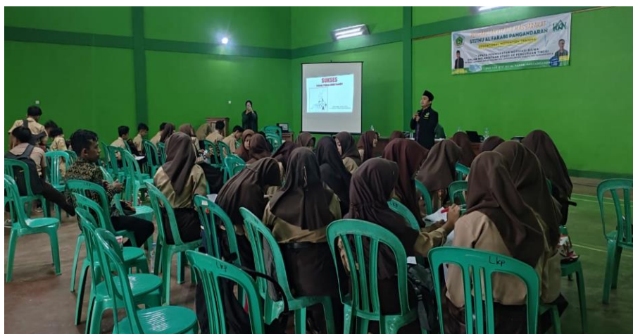
Gambar 4 Proses Penyampaian Materi Pada Kegiatan Seminar Motivation Educational Training

Narasumber dalam kegiatan pengabdian ini adalah dosen dan mahasiswa STITNU Al-Farabi Pangandaran, adapun materi yang disampaikan sesuai dengan tema yang telah ditentukan sebelumnya diantaranya tentang 1) urgensi dan/atau pentingnya pendidikan dalam kehidupan, 2) training motivation “menjadi sukses adalah sebuah pilihan”, yaitu memberikan motivasi untuk melanjutkan sekolah ke jenjang pendidikan yang lebih tinggi, dan materi untuk mengetahui minat dan bakat yang ada pada diri siswa. Selain penyampaian dan pembahasan materi yang disampaikan, pemateri juga memberikan tantangan great plan of life (harapan ke depan dari tahun ke tahun berikutnya) serta mempersilahkan siswa siswi untuk memberanikan diri mempresentasikan harapan-harapan tersebut dan siswa/siswi diperbolehkan untuk bertanya atau sharing-sharing terkait materi yang telah disampaikan.