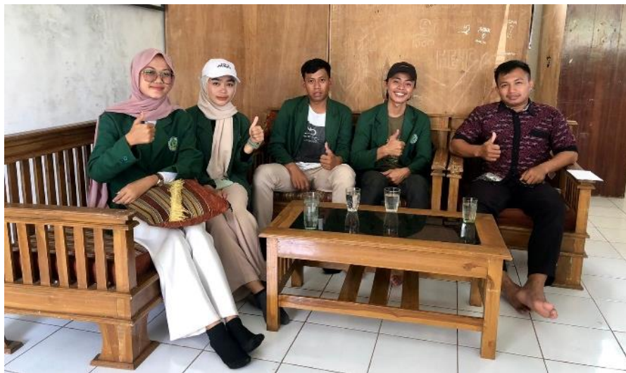
Gambar 3. Selepas Kegiatan Observasi, Wawancara dan Dokumentasi salah satu Kepala Sekolah SLTA Desa Langkaplancar

relevan (stakeholder) dalam mengkaji tindakan yang sedang berlangsung (dimana pengalaman mereka sendiri sebagai persoalan) dalam rangka melakukan perubahan dan perbaikan kearah yang lebih baik. Oleh karena itu, mereka harus melakukan refleksi kritis terhadap konteks sejarah, politik, Pendidikan, budaya, ekonomi, geografis dan konteks lain terkait, yang mendasari dilakukannya PAR adalah kebutuhan kita untuk mendapatkan perubahan yang diinginkan. Dengan demikian, sesuai istilahnya PAR memiliki tiga pilar utama, yakni metodologi riset, dimensi aksi, dan dimensi partisipasi. Artinya, PAR dilaksanakan dengan mengacu metodologi riset tertentu, harus bertujuan untuk mendorong aksi transformatif, dan harus melibatkan sebanyak mungkin masyarakat warga atau anggota komunitas sebagai pelaksana PAR-nya sendiri.