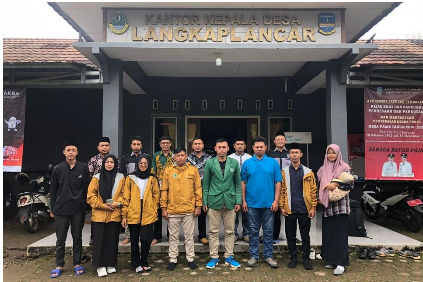
Gambar 2. Selepas Kegiatan Observasi, Wawancara dan Dokumentasi Bersama Pemerintah Desa dan BPD Desa Langkaplancar

Salah satu ukuran IPM adalah rata-rata lamanya pendidikan penduduknya. Semakin banyak penduduk dapat melanjutkan pendidikan ke jenjang pendidikan yang lebih tinggi seperti diploma/Strata satu/Magister maka IPM nya akan semakin tinggi. Oleh karena itu penting dilakukan upaya peningkatan IPM Indonesia dan yang paling penting agar anak-anak tidak ada yang putus sekolah.