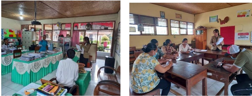
Gambar 1 dan 2 Pemberian Pelatihan

Gambar 1 dan 2 merupakan gambaran umum dari pelaksanaan kegiatan pengabdian kepada masyarakat (PKM). Kegiatan ini dilakukan dengan menggunakan metode ceramah, tanya jawab, dan diskusi. Kegiatan ini merupakan pengabdian dalam rangka menumbuhkan minat dan kesadaran para Guru di Gugus V Mandara Giri Kecamatan Kubutambahan untuk dapat membuat keputusan investasi yang baik dan bijak, sehingga dapat menyiapkan masa pensiun dengan baik. Berdasarkan hasil survey dan konsultasi dengan Ketua Gugus V Mandara Giri Kecamatan Kubutambahan, maka pada tanggal 24 dan 25 Maret 2023 telah dilaksanakan kegiatan sosialisasi dan pelatihan literasi keuangan tentang pentingnya investasi bagi para guru.