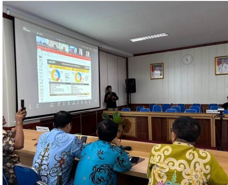
Gambar 1. Rapat Persiapan Misi Dagang Kalteng-Jatim melalui Zoom, 13 Maret 2026

Tahap kedua adalah koordinasi administratif pada 25-31 Maret 2026, mencakup pengantaran surat undangan resmi, pencatatan notulen rapat lanjutan yang membahas draft PKS dan MoU bersama sembilan OPD, serta penyampaian surat Gubernur Jawa Timur untuk proses penandatanganan.