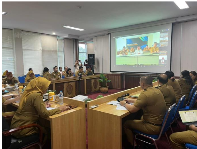
Gambar 2. Rapat Koordinasi Lintas OPD Penelaahan Draft PKS, 30 Maret 2026

Tahap kedua adalah koordinasi administratif pada 25-31 Maret 2026, mencakup pengantaran surat undangan resmi, pencatatan notulen rapat lanjutan yang membahas draft PKS dan MoU bersama sembilan OPD, serta penyampaian surat Gubernur Jawa Timur untuk proses penandatanganan.