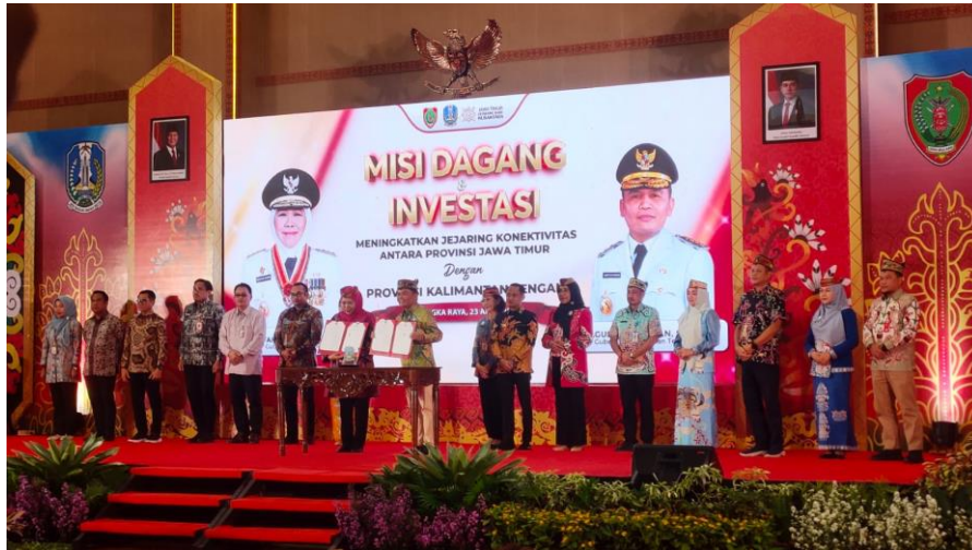
Gambar 3. Penandatanganan MoU dan PKS oleh Gubernur Jatim dan Kalteng, 23 April 2026