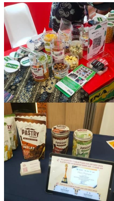
Gambar 5. Produk UMKM Jawa Timur