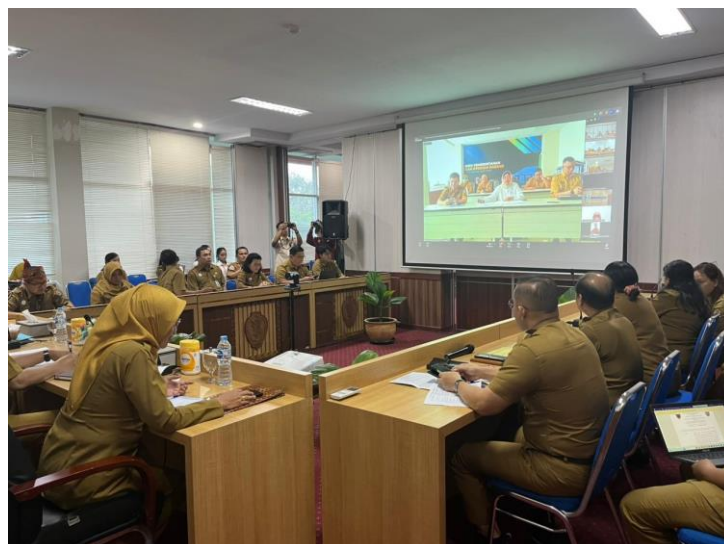
Gambar 3. Rapat Final Misi Dagang Antara Kalimantan Tengah dan Jawa Timur

Partisipasi mahasiswa dalam kegiatan misi dagang menjadi bentuk implementasi langsung pengabdian kepada masyarakat melalui pendampingan terhadap pelaku UMKM. Dalam kegiatan ini, mahasiswa membantu proses koordinasi kegiatan, penyediaan informasi, serta mendampingi pelaku usaha selama pelaksanaan promosi produk dan interaksi bisnis berlangsung.