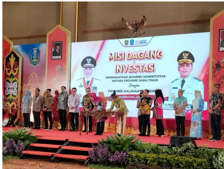
Gambar 6. Penandatanganan Kesepakatan Kerja Sama Misi dagang dan Investasi antara Jawa Timur dan Kalimantan Tengah

Capaian tersebut tidak terlepas dari komitmen pemerintah daerah dalam memperkuat konektivitas dan integrasi ekonomi antar wilayah (Metro TV News, 2026; Seputar Borneo, 2026). Penandatanganan nota kesepahaman (MoU) turut menjadi dasar penting dalam menjamin keberlanjutan kerja sama, sekaligus mencerminkan bahwa kerja sama antar daerah tidak hanya bersifat seremonial tetapi memiliki landasan administratif yang kuat (Setda Provinsi Kalimantan Tengah, 2026; Biro Administrasi Pimpinan Provinsi Kalimantan Tengah, 2026). Hal ini memperkuat pandangan Novitasari et al. (2025) yang menyatakan bahwa kerja sama antar daerah yang dilandasi dokumen formal yang tertib akan lebih efektif dalam mendorong pertumbuhan ekonomi dan pertukaran pengetahuan antar wilayah.