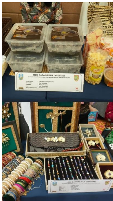
Gambar 4. Produk UMKM Kalimantan Tengah

Pelaksanaan misi dagang antara Provinsi Kalimantan Tengah dan Jawa Timur menghasilkan capaian transaksi yang mencapai lebih dari Rp2,08 triliun (Klik Jatim, 2026; Ketik.com, 2026). Capaian tersebut menunjukkan bahwa kegiatan kerja sama antar daerah memiliki potensi besar dalam memperluas jaringan pemasaran dan meningkatkan peluang ekonomi bagi pelaku UMKM.