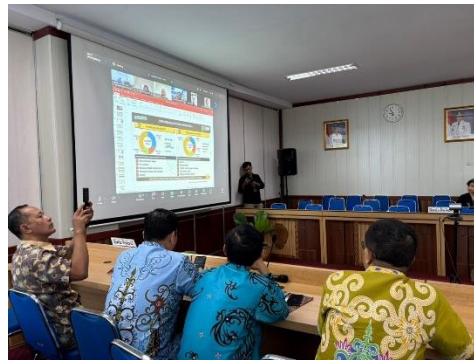
Gambar 1. Rapat Misi Dagang Mengenai Produk Yang Akan Diromosikan

Salah satu bentuk kegiatan pengabdian yang dilakukan adalah pendampingan administrasi kepada pelaku UMKM dan pihak terkait dalam kegiatan misi dagang. Pendampingan dilakukan melalui bantuan pengelolaan dokumen kegiatan, penyusunan nota dinas, penyiapan data produk, serta pengarsipan dokumen kerja sama. Mahasiswa turut membantu memastikan kelengkapan dokumen yang digunakan selama kegiatan berlangsung sehingga proses koordinasi menjadi lebih efektif dan terstruktur.