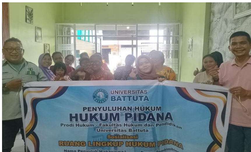
Gambar 2. Foto Bersama Selesai Kegiatan

Adapun langkah-langkah yang telah diambil untuk mengatasi kejahatan pencurian adalah dengan melakukan tindakan pencegahan melalui program penyuluhan hukum, langkah-langkah preventif dengan melaksanakan patroli secara rutin di area serta waktu-waktu rawan, memperkuat peran dan fungsi Bhabinkamtibmas, sedangkan tindakan represif dilakukan dengan menjatuhkan sanksi hukum kepada pelaku kejahatan pencurian (Junaidi Lubis, Haris Dermawan, 2024).