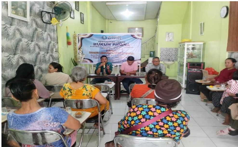
Gambar 1. Pada Saat Penyampaian Materi

Dengan adanya kegiatan penyuluhan hukum ini masyarakat jauh lebih memahami tentang bagaimana cara bekerjanya hukum dalam masyarakat agar juga bisa melaporkan kejadian yang sama kepada kepada lingkungan setempat untuk dapat dilakukan pendekatan secara kekeluargaan lebih dulu sebelum menempuh upaya hukum. Selama kegiatan penyuluhan berlangsung masyarakat kelihatan senang dengan mengajukan berbagai macam pertanyaan tentang apa yang sudah mereka alami agar kedepan bisa mensiasatinya agar tidak lagi jadi korban dari tindak pidana yang sama. Bahkan tidak jarang para peserta penyuluhan kelihatan begitu kesal, mengingat sudah banyaknya kerugian yang mereka alami (Junaidi Lubis, Eka Faizin Hidayat, 2025)