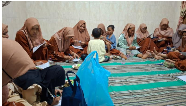
Gambar 4. Pengisian Post-test pada Partisipan

pentingnya konsumsi air putih dan kebersihan makanan yang pada post-test mencapai persentase jawaban benar hingga 100%. Hal ini menunjukkan bahwa materi yang disampaikan dapat dipahami dengan baik oleh sebagian besar partisipan (Gambar 4).