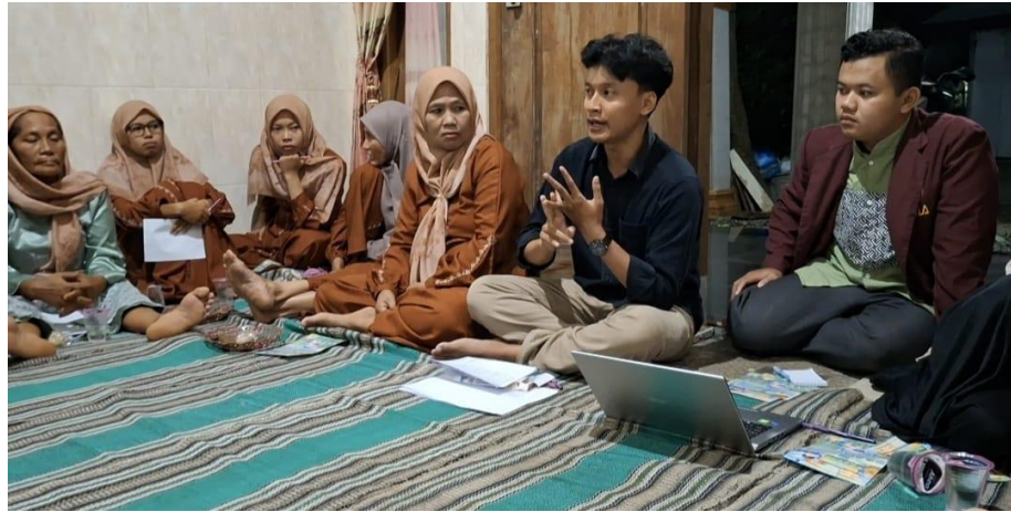
Gambar 2. Pemberian materi tentang penggunaan obat gangguan saluran cerna

yang menyebutkan bahwa pengetahuan dan sikap masyarakat terhadap penggunaan obat berperan penting dalam menunjang keberhasilan pengobatan, pengelolaan obat yang efektif, serta keselamatan pasien (Kamal, et al. , 2024).