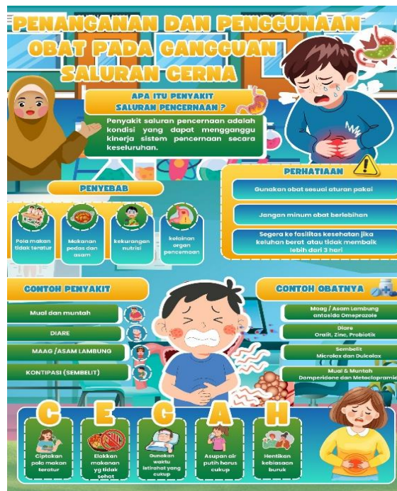
Gambar 1. Media Brosur Edukasi

Tahapan ini diawali dengan pembentukan tim pengabdian dan koordinasi internal untuk perencanaan kegiatan. Selanjutnya dilakukan observasi awal dan wawancara dengan pengurus desa serta tenaga kefarmasian setempat guna mengidentifikasi permasalahan dan kebutuhan masyarakat. Berdasarkan hasil tersebut, ditetapkan sasaran kegiatan yaitu ibu-ibu pengajian Desa Dlanggu, Kecamatan Deket, Kabupaten Lamongan, serta disiapkan media edukasi berupa brosur dan flipbook sebagai sarana pendukung penyampaian informasi agar materi lebih mudah dipahami dan dapat dipelajari kembali oleh peserta.