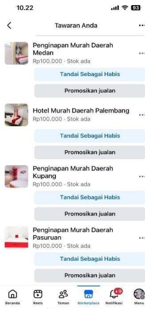
Gambar 3. Unggahan Promosi Kamar melalui Facebook

Secara kualitatif, perubahan yang dirasakan peserta terlihat dari meningkatnya pemahaman mengenai konsep kewirausahaan digital, alur pemesanan kamar, serta kemampuan dalam menyusun konten promosi dan berkomunikasi dengan calon konsumen. Peserta tidak hanya mampu melakukan promosi secara mandiri, tetapi juga mulai memahami pola komunikasi yang lebih persuasif dan profesional. Dampak awal pendampingan ditunjukkan dengan terjadinya transaksi pemesanan kamar sebagai implementasi langsung dari keterampilan yang diperoleh.