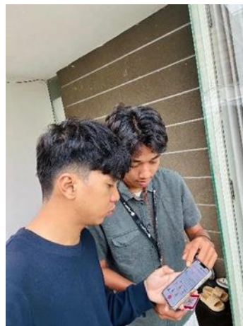
Gambar 2. Pendampingan Registrasi Akun RedSeller

Secara kuantitatif, tingkat konversi peserta dari tahap sosialisasi menuju partisipasi aktif mencapai 37,5% (3 dari 8 mahasiswa). Seluruh peserta yang melanjutkan ke tahap pendampingan berhasil menyelesaikan proses registrasi akun dan mampu memanfaatkan fitur dasar aplikasi RedSeller untuk kegiatan promosi serta transaksi pemesanan kamar.