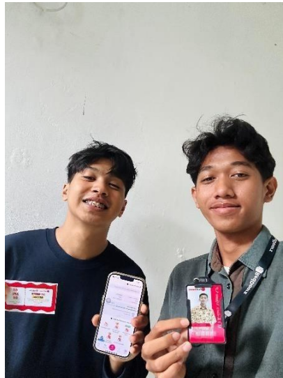
Gambar 1. Proses Sales Call dan Sosialisasi Program Reseller Properti Digital

Secara kuantitatif, tingkat konversi peserta dari tahap sosialisasi menuju partisipasi aktif mencapai 37,5% (3 dari 8 mahasiswa). Seluruh peserta yang melanjutkan ke tahap pendampingan berhasil menyelesaikan proses registrasi akun dan mampu memanfaatkan fitur dasar aplikasi RedSeller untuk kegiatan promosi serta transaksi pemesanan kamar.