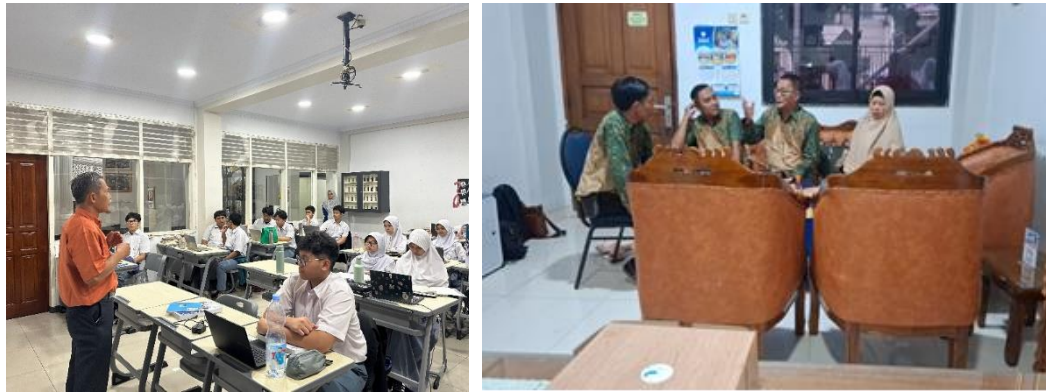
Gambar 3. Peserta magang mengeksplorasi kegiatan pembelajaran dan tindakan kelas pada guru di Limau Bendi School

Dalam wawancara dan paparan, kepala sekolah difasilitasi menyampaikan visi, kebijakan, implementasi dan tantangan serta dukungan dari sistem pengembangan yang dibangun. Selanjutnya dalam FGD dengan peserta magang dilakukan analisis reflektif dan potensi adaptasi antara lain 1) identifikasi praktik baik yang berpotensi dilakukan, 2) Faktor penghambat dan pendukung yang dimiliki oleh lembaga pendidikan, 3) rencana adaptasi yang mungkin dan diprioritaskan dan modifikasi yang dapat dilakukan.