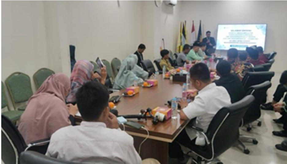
Gambar 5. Peserta magang menyampaikan hasil temuannya kepada peserta lain bersama dengan manajemen Limau Bendi School

Hasil pengumpulan data selanjutnya disajikan dan dianalisis dengan pola 1) pemaparan temuan praktik baik, analisis faktor pendukung dan penghambat, 3) Analisis potensi adaptasi dan rekomendasi, 4) dan refleksi sebagai bentuk pengabdian masyarakat sebagai upaya keberlanjutan program dan diseminasi hasil.