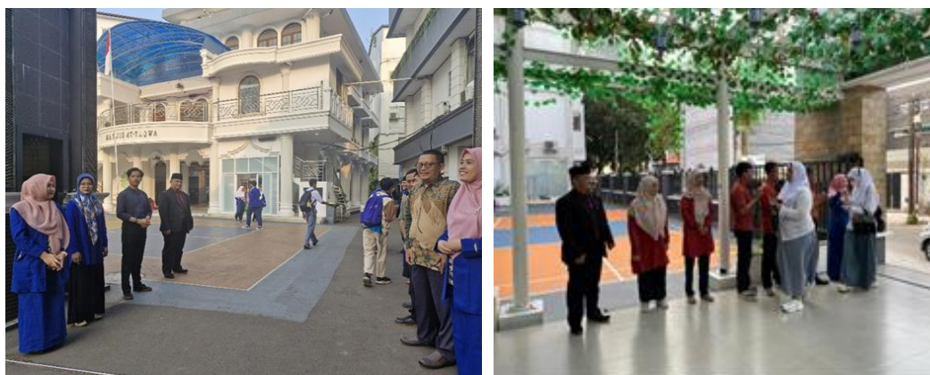
Gambar 2. Peserta magang dan Guru Limau Bendi School melaksanakan kegiatan Salaam Sambut Pagi

Eksplorasi kegiatan peserta dilakukan selama 1 hari. Salah satu hal yang dilakukan peserta adalah kegiatan Salam Sambut Pagi yang dilaksanakan di lembaga pendidikan ini. Kegiatan ini dilaksanakan oleh bapak Ibu guru yang bertugas dan peserta ikut berpartisipasi sekaligus mengobservasi kegiatan (gambar 2). Selain itu peserta juga diarahkan untuk mengikuti kegiatan pembelajaran di kelas dan melakukan wawancara dengan guru mata pelajaran untuk mengeksplorasi tindakan kelas dan metode pembelajaran yang dilaksanakan (gambar 3).