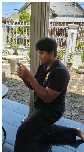
Gambar 3. Pengambilan Gambar

Tahap produksi dan editing konten merupakan proses lanjutan setelah perencanaan disusun secara matang dan disetujui oleh tim media sosial Birojasa.official. Pada tahap ini, seluruh rancangan konten yang telah dituangkan dalam content planning mulai direalisasikan dalam bentuk visual maupun desain grafis yang siap untuk dipublikasikan. Proses produksi dilakukan berdasarkan jadwal yang telah ditetapkan agar setiap konten dapat terunggah secara konsisten dan sesuai dengan kebutuhan strategi komunikasi digital yang ingin dicapai.