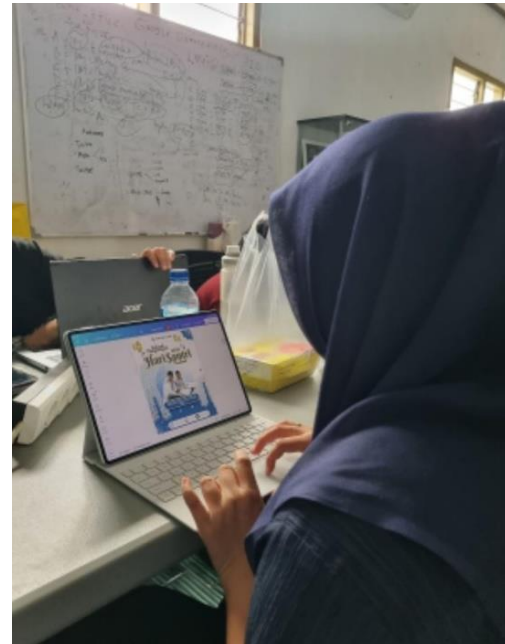
Gambar 5. Editing Desain Grafis

Gambar 4 dan gambar 5, menjelaskan setelah produksi selesai, tahap selanjutnya adalah melakukan proses editing. Editing konten dalam bentuk video maupun desain grafis dilakukan untuk memastikan kualitas konten tetap profesional, rapi, dan sesuai standar tim media sosial. Pada tahap ini, konten diperiksa dari berbagai aspek seperti ketepatan informasi, kejelasan pesan, kualitas visual, keseimbangan komposisi desain, hingga kesesuaian tone brand. Jika ditemukan elemen yang belum optimal, konten akan diperbaiki terlebih dahulu sebelum akhirnya disetujui untuk dipublikasikan. Proses editing ini juga mencakup penyempurnaan caption agar lebih komunikatif, relevan, dan persuasif sehingga mampu menarik minat pengguna media sosial.