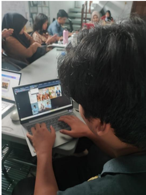
Gambar 4. Editing Visual Reels