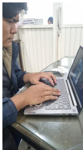
Gambar 6. Proses Publikasi

Gambar 11, menjabarkan mengenai penjadwalan yang merupakan kegiatan finalisasi konten setelah dilakukan proses produksi dan mendapatkan persetujuan dari Tim media sosial. Dalam kegiatan ini, Tim abdimas menggunakan kalender unggahan yang telah disusun pada tahap perencanaan. Kalender ini berisi waktu dan tanggal publikasi untuk setiap konten, termasuk platform yang akan digunakan, seperti Instagram, TikTok, atau Facebook. Dengan adanya penjadwalan yang jelas, tim dapat menghindari penumpukan unggahan pada satu hari atau kekosongan konten dalam jangka waktu tertentu. Penjadwalan juga mempertimbangkan jam tayang yang paling efektif, yaitu waktu ketika audiens cenderung lebih aktif berinteraksi di media sosial, sehingga peluang untuk mendapatkan engagement seperti likes, komentar, dan share dapat meningkat.