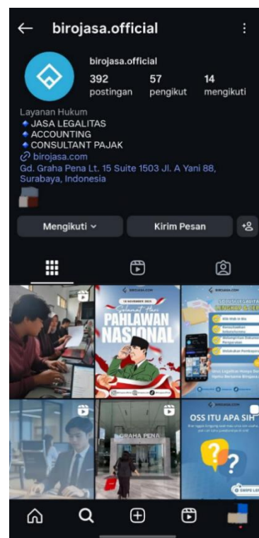
Gambar 7. Sebelum Pelaksanan Abdimas Gambar 8. Sesudah Pelaksanan Abdimas

Gambar 7 dan gambar 8 menerangkan berdasarkan data awal, sebelum pelaksanaan Abdimas, akun Instagram Birojasa.official memiliki 374 postingan, 49 pengikut, dan mengikuti 14 akun. Angka tersebut menunjukkan aktivitas yang cukup banyak, namun belum diimbangi dengan perkembangan jumlah pengikut yang signifikan karena kurangnya konsistensi unggahan dan belum optimalnya strategi konten. Setelah kegiatan Abdimas berlangsung selama 10 Minggu, terjadi perubahan positif yang menunjukkan adanya peningkatan performa akun. Data evaluasi akhir menunjukkan bahwa jumlah postingan naik menjadi 392 unggahan, pengikut meningkat menjadi 57 followers, sementara jumlah akun yang diikuti tetap 14 akun.