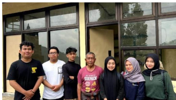
Gambar 5. Foto Bersama Pengelola Curug Silawe

Seluruh kegiatan pelaksanaan berjalan lancar berkat kerja sama yang baik dengan pengelola Curug Silawe. Dokumentasi kerja sama tersebut terlihat pada Gambar 5.