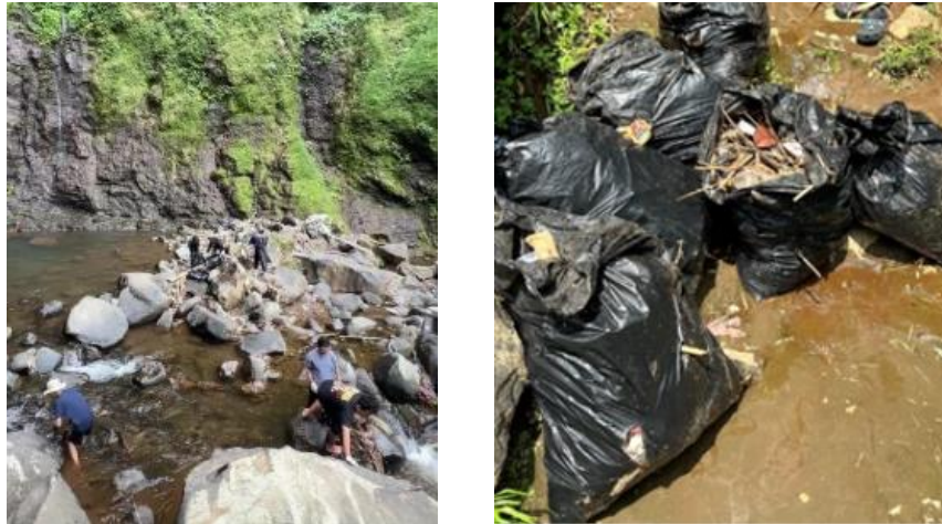
Gambar 2. Kegiatan pembersihan dan hasil sampah yang didapatkan di Curug Silawe

Setelah pembersihan dilakukan, perubahan pada lingkungan terlihat signifikan pada gambar 3. Area curug tampak lebih bersih, rapi, dan nyaman dikunjungi. Perbandingan kondisi sebelum dan sesudah kegiatan menunjukkan bahwa aksi sederhana mampu memberikan dampak nyata bagi pelestarian lingkungan.