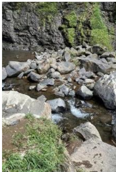
Gambar 3. Keadaan Curug Silawe setelah dibersihkan

Setelah pembersihan dilakukan, perubahan pada lingkungan terlihat signifikan pada gambar 3. Area curug tampak lebih bersih, rapi, dan nyaman dikunjungi. Perbandingan kondisi sebelum dan sesudah kegiatan menunjukkan bahwa aksi sederhana mampu memberikan dampak nyata bagi pelestarian lingkungan.