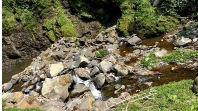
Gambar 1. Keadaan Curug Silawe sebelum dibersihkan

Pada tahap pelaksanaan, kegiatan dimulai dengan turun langsung ke lokasi untuk melakukan observasi partisipatif dan pengumpulan data. Tim ikut serta dalam kegiatan bersih-bersih untuk memahami kebiasaan pengelola terkait pengelolaan kebersihan kawasan wisata. Temuan awal menunjukkan bahwa sebelum kegiatan dilakukan, kondisi Curug Silawe belum mencerminkan destinasi wisata alam yang terkelola dengan baik. Area sekitar curug dipenuhi sampah dari alam, aktivitas pengunjung, hingga limbah rumah tangga warga sekitar seperti yang terlihat Gambar 1 sehingga menurunkan nilai estetika serta kenyamanan wisatawan.