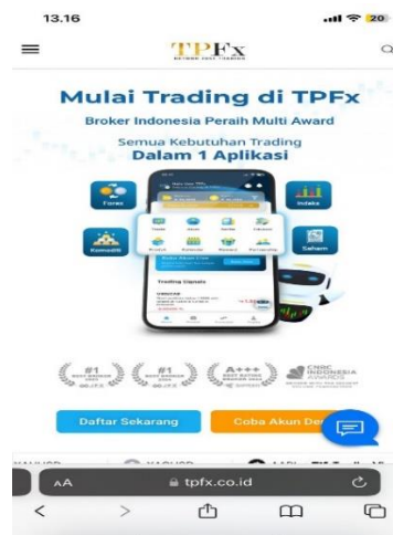
Gambar 3. Pengenalan platform yang digunakan di PT Trijaya Pratama Futures

Para karyawan menggunakan pendekatan ramah dan persuasif, menjawab pertanyaan pengunjung secara langsung, dan membagikan brosur edukatif. Aktivitas ini bertujuan agar masyarakat lebih memahami fungsi perusahaan pialang, membangun kepercayaan, serta menciptakan citra positif TPFX di mata publik. Kegiatan ini juga memanfaatkan lokasi strategis seperti Starbucks Tunjungan Plaza, yang memiliki banyak pengunjung, sehingga pesan edukasi dapat tersampaikan secara lebih luas dan efektif.