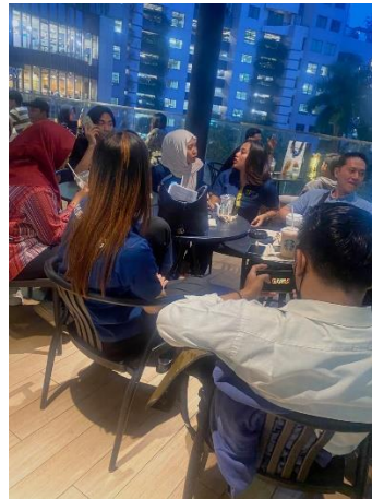
Gambar 2. Beberapa Tenaga Kerja TPFX sedang menjelaskan tentang perusahaan

kepercayaan awal kepada calon nasabah. Pendekatan ini sejalan dengan konsep pemasaran edukatif, di mana proses penyampaian informasi difokuskan pada peningkatan pemahaman masyarakat terhadap legalitas dan risiko investasi, bukan semata-mata pada aspek penawaran layanan. Dengan demikian, kegiatan canvassing di ruang publik seperti mall dapat berfungsi sebagai media pengabdian masyarakat yang efektif dalam meningkatkan literasi keuangan dan membentuk persepsi positif terhadap perusahaan pialang.