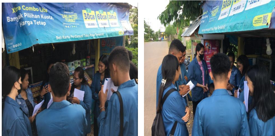
Gambar 1. Tim melakukan identifikasi dan analisis kebutuhan Mitra

Temuan ini mendukung studi sebelumnya yang menyatakan bahwa mayoritas pelaku UMKM di sektor informal memiliki literasi keuangan yang minim dan belum menerapkan prinsip dasar akuntansi (Nay et al., 2024). Oleh karena itu, kegiatan pelatihan akuntansi sederhana menjadi sangat relevan dan tepat sasaran.