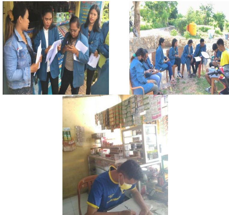
Gambar 2. Kegiatan Pelatihan dan Pendampingan

pendekatan experiential learning yang menekankan pembelajaran berbasis pengalaman langsung, dan terbukti efektif dalam konteks pemberdayaan UMKM (Kusumawati et al., 2024).