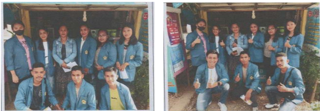
Gambar 4. Evaluasi dan Rencana Tindak Lanjut

Tim merekomendasikan pengembangan lebih lanjut berupa pelatihan digitalisasi pencatatan keuangan dengan aplikasi sederhana berbasis Ms. Excel atau aplikasi mobile (misalnya BukuKas, Catatan Keuangan Harian, atau Akuntansi untuk UKM) (Goetha et al., 2024; Hamdan et al., 2025). Mitra juga diusulkan menjadi kios percontohan dalam kegiatan PkM selanjutnya bagi usaha dagang lain yang sejenis.