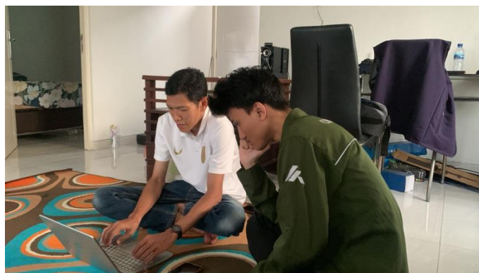
Gambar 1. Pendampingan mahasiswa

Setelah itu, kelompok dan mahasiswa menentukan masalah lokal apa yang menjadi perhatian masyarakat. Pemantauan berita lokal, wawancara dengan pejabat setempat, dan pemantauan diskusi di media sosial oleh netizen digunakan untuk melaksanakan pendekatan ini. Berdasarkan temuan identifikasi, warga Sidoarjo sangat membutuhkan informasi yang bermanfaat tentang layanan publik, peluang pendidikan, dan pertumbuhan UMKM. Konten yang menawarkan solusi praktis, termasuk detail tentang proses administratif, bantuan akses, atau jadwal layanan, juga mendapatkan respons yang lebih besar dari audiens. Tim redaksi Metro Today dapat memanfaatkan informasi ini untuk memfokuskan liputan beritanya pada topik-topik yang lebih relevan dengan kehidupan sehari-hari pembacanya, sehingga hasil liputannya menjadi lebih bernilai.