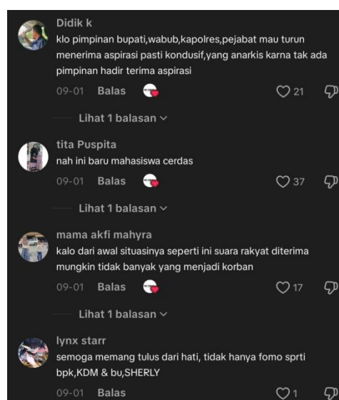
Gambar 4. Komentar positif dari netizen

Dana pensiun Kepolisian Nasional Indonesia, yang dianggap sebagai beban keuangan bagi anggaran negara, mendapat kritikan dalam pernyataan tersebut. Hal ini menunjukkan bagaimana masyarakat turut berperan dalam memantau kebijakan negara dalam konteks demokrasi. Jawaban Metro Today menunjukkan bagaimana ruang digital telah berkembang menjadi platform komunikasi antara masyarakat dan media, memungkinkan mereka untuk bebas mengemukakan pendapat dan berpartisipasi dalam diskusi yang terbuka.