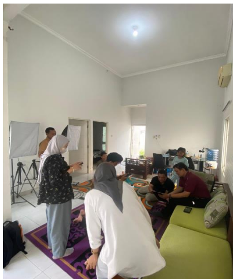
Gambar 2. Mahasiswa mendampingi tim redaksi

Selain itu, staf Metro Today menerima instruksi tentang cara menetapkan jadwal penerbitan yang lebih teratur. Tim redaksi mengembangkan jadwal redaksi mingguan yang membagi kategori konten menjadi bagian-bagian untuk fitur, berita terkini, dan pendidikan melalui pelatihan dan simulasi. Alur kerja tim menjadi lebih terorganisir dan beban produksi dapat didistribusikan secara adil dengan jadwal ini. Harapan audiens yang semakin tinggi terhadap bagian-bagian tertentu dipengaruhi oleh konsistensi jadwal tersebut. Misalnya, pemirsa mulai menantikan program mingguan yang mencakup informasi layanan publik atau aktivitas UMKM. Akibatnya, pembuatan jadwal penerbitan tidak hanya meningkatkan produktivitas tim tetapi juga membentuk pola konsumsi audiens.