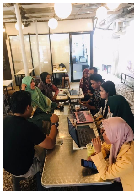
Gambar 2. Kegiatan Diskusi