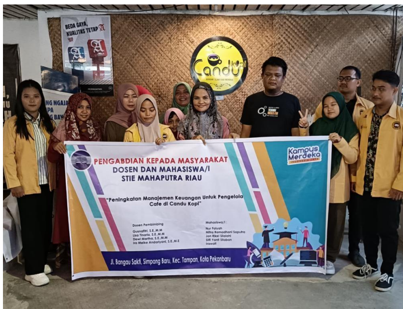
Gambar 3. Foto Bersama Peserta dan team PKM

ekonomi melalui intervensi berbasis pengetahuan yang ditopang oleh kemitraan antara akademisi dan masyarakat (Suparno, 2018).