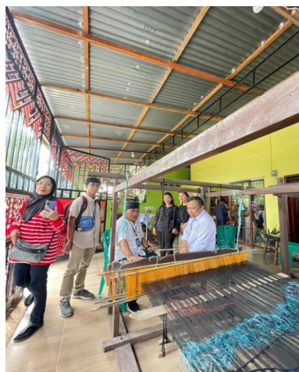
Gambar 2. Foto Sosialisasi team Pengabdian UMA di Desa Sidorejo hilir Kecamatan Medan Tembung