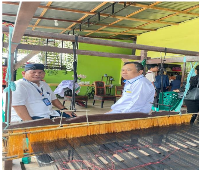
Gambar 4. Foto Bersama team Pengabdian UMA dengan peserta Pengembangan kompetensi SDM di Desa Sidorejo hilir Kecamatan Medan Tembung