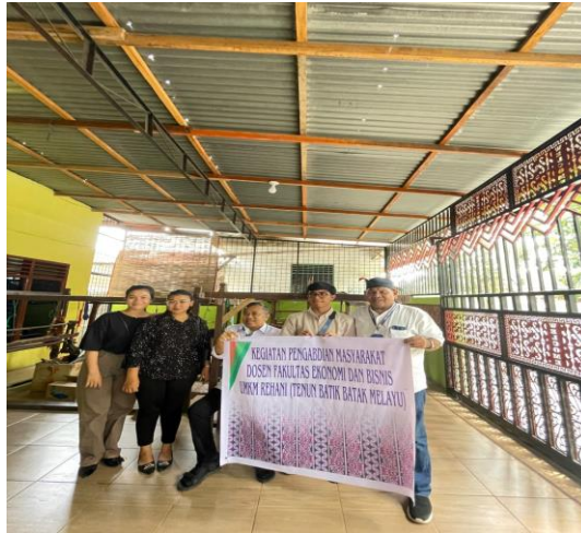
Gambar 1. Team Pengabdian UMA dalam Pengembangan kompetensi SDM di Desa Sidorejo hilir Kecamatan Medan Tembung