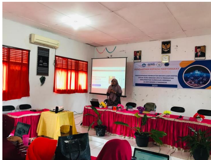
Gambar 7. Pendampingan Pembuatan Video Pembelajaran Menggunakan Doratoon

Pertemuan kesembilan dan kesepuluh dilakukan pada tanggal 17 September 2023. Pada pertemuan ini dijelaskan tentang fitur-fitur dari doratoon dan kepada guru juga diberi pendampingan dalam pembuatan video pembelajaran menggunakan doratoon . Guru juga memberikan respon positif terhadap doratoon , karena sangat praktis digunakan untuk membuat video pembelajaran.