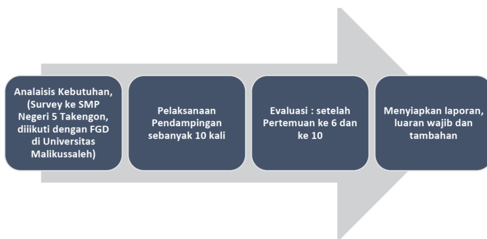
Gambar 1. Alur Pendampingan

Langkah yang dilakukan pada pengabdian masyarakat pendampingan pembuatan bahan ajar digital di SMP Negeri 05 Takengon digambarkan melalui alur berikut: