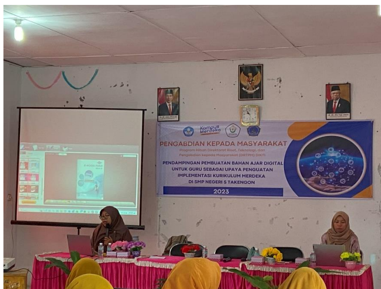
Gambar 2. Pendampingan Pembuatan Bahan Ajar Digital

Kegiatan pendampingan di awal pertemuan 1, menyampaikan materi berkaitan dengan flipbook maker , dilaksanakan pada tanggal 05 Agustus 2023. Kemudian pada tanggal yang sama dilanjutkan dengan pertemuan 2 dengan agenda melakukan pendampingan kepada guru dalam membuat bahan ajar digital menggunakan kvsoft office flipbook maker dan webflip html . Kegiatan ini dilakukan pada Sabtu 05 Agustus 2023 jam 13.30 -17.30 dan diikuti oleh 28 orang guru. Pada akhir kegiatan ini guru diminta untuk mempresentasikan bahan ajar menggunakan kvsoft office flipbook maker dan webflip html yang telah dibuat. Guru sangat senang dengan kvsoft office flipbook maker dan webflip html ini, karena dapat menyajikan buku yang di dalamnya bisa memuat video, audio, animasi, dan lain sebagainya. Selain itu, buku elektronik yang dibuat menggunakan flipbook maker dapat dengan mudah dibagikan kepada siswa, sehingga memudahkan siswa mengakses dimanapun dan kapanpun (Anandari et al., 2019). Sehingga pembelajaran mandiri sesuai dengan tuntutan kurikulum merdeka dapat terlaksana (Sumarsih et al., 2022).