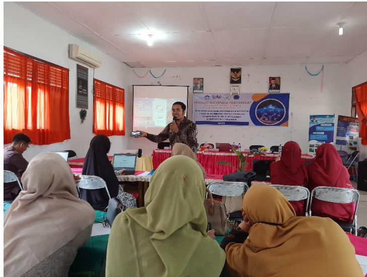
Gambar 6. Pendampingan Pembuatan Video Pembelajaran Menggunakan Kinemaster

pendampingan ini, karena pembuatan video menggunakan aplikasi kinemaster sangat mudah, selain itu kinemaster ini merupakan aplikasi mobile yang dirancang untuk pengguna smartphone dan video yang disajikan lebih menarik (Fitri & Ardipal, 2021).