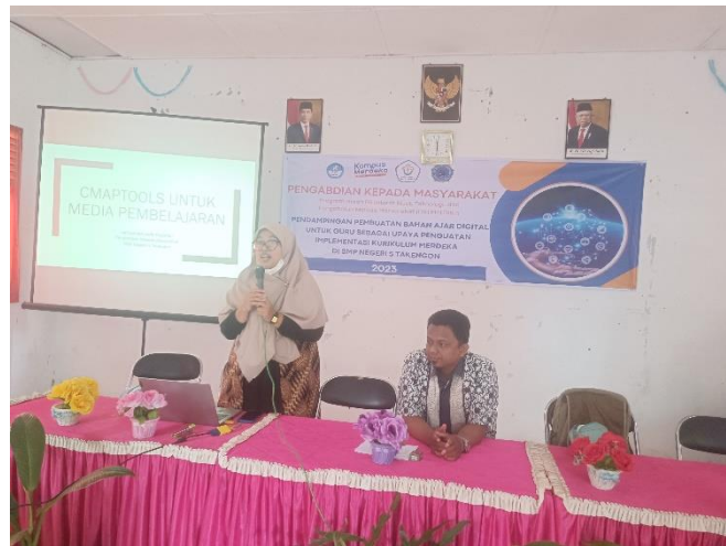
Gambar 3. Pedampingan Pembuatan Media Pembelajaran Digital Menggunakan Cmptools

menggunakan cmptools yang telah dibuat. Guru memberikan respon positif dan menunjukkan ketertarikan lebih lanjut pada cmptools , karena dapat menyajikan peta konsep suatu materi, dan guru bisa melampirkan penjelasan lebih dalam dari konsep melalui video, PPT, gambar, animasi, dan lainnya. Hal ini sejalan dengan yang disampaikan oleh Suprpto, bahwa bahan ajar berupa cmptools merupakan media pembelajaran yang kompleks, karena tidak hanya menggambarkan ketertarikan antar konsep, namun juga memberikan penjelasan lebih mendalam berkaitan dengan konsep dengan fitur lampirkan file dan tautan web (Suprpto et al., 2018).