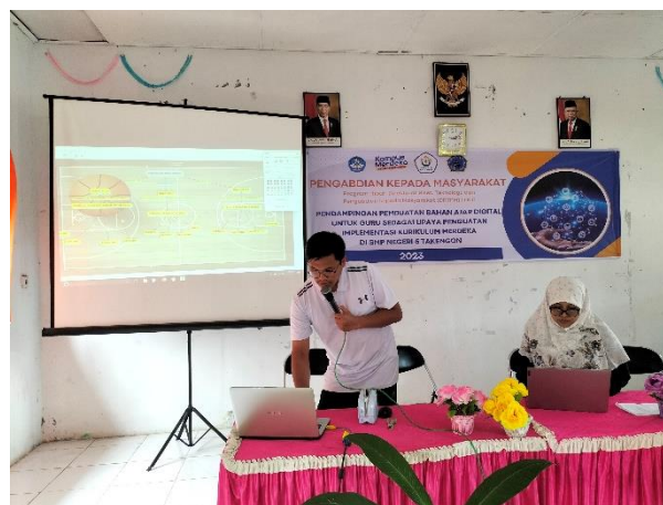
Gambar 4. Pedampingan Pembuatan Bahan Ajar Digital Menggunakan Canva

Selanjutnya dilakukan pertemuan kelima untuk menyampaikan materi berkaitan dengan Canva yang dilaksanakan pada tanggal 05 Agustus 2023. Kemudian dilanjutkan dengan pendampingan kepada guru dalam membuat bahan ajar digital menggunakan Canva jam 13.30 - 17.30. Guru memberikan respon positif berkaitan dengan pendampingan Canva dan guru memberikan pendapat bahwa aplikasi Canva untuk dapat mendesain bahan ajar secara kreatif. Bahan ajar yang dikembangkan melalui Canva juga mampu digunakan dimana saja dan kapan saja, karena juga dapat disebarluaskan melalui tautan (Setiawan & Jatmikowati, 2021) (Putri et al., 2023).