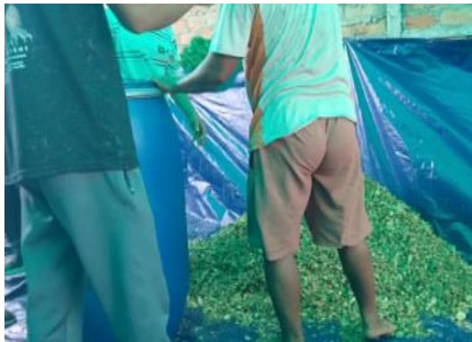
Gambar 7. Penyiapan Pelaksanaan Fermentasi

Cacahan tebon jagung yang telah diberi larutan fermentasi selanjutnya dimasukkan dalam wadah drum dan drum ditutup rapat untuk menghindari masuknya udara saat proses fermentasi. Proses fermentasi pakan dilakukan selama tiga minggu dan selama proses tersebut tutup wadah drum tidak dibuka. Sebelum pelaksanaan fermentasi cacahan tebon jagung berwarna hijau dan setelah pelaksanaan fermentasi selama 21 hari warnanya menjadi coklat disebabkan adanya pigmen phatophitin. Menurut Rupy et al, 2023 warna cacahan limbah jagung yang berwarna hijau mengalami perubahan warna selama proses insilasi akibat adanya reaksi respirasi earobik selama proses fermentasi didalam silo.