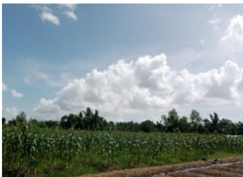
Gambar 1. Kebun Jagung Milik Mitra

Mitra kegiatan merupakan kelompok tani-ternak yang terdapat di kampung Kuper, terdiri dari 9 petani yang mengusahakan budidaya jagung manis dan juga memiliki ternak sapi, 8 petani hanya membudidayakan jagung manis, dan 6 peternak sapi. Berdasarkan wawancara dengan petani yang membudidayakan jagung manis, sebagian besar limbah tebon jagung yang dihasilkan tidak dimanfaatkan dan hanya sebagian kecil yang dimanfaatkan sebagai pakan ternak dalam bentuk hijauan segar. Tebon jagung yang tidak dimanfaatkan umumnya dibiarkan mengering lalu dibakar.