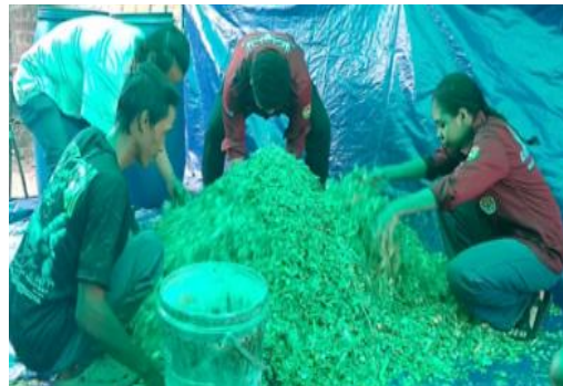
Gambar 6. Praktek Pembuatan Pakan