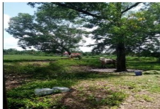
Gambar 2. Ternak Sapi Milik Mitra