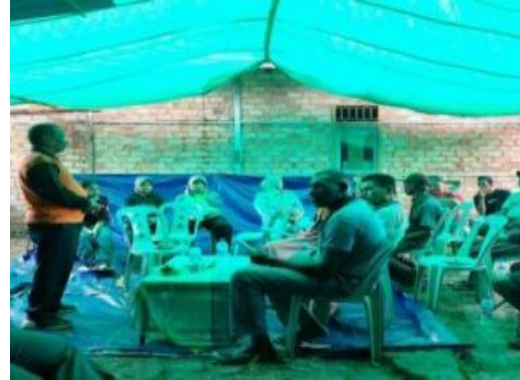
Gambar 4. Sosialisasi Pakan Ternak