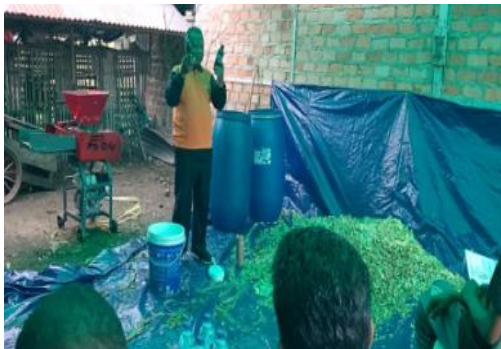
Gambar 5. Penjelasan Cara Pembuatan Pakan

Pemaparan terkait pengolahan limbah tebon jagung dijelaskan beberapa tahapan pengerjaan yang meliputi penyiapan dan pencacahan tebon jagung, penyiapan bahan pembuatan larutan fermentasi, pencampuran cacahan tebon jagung dengan larutan fermentasi, pelaksanaan fermentasi serta pemanenan pakan tebon jagung hasil fermentasi (Hetharia et al., 2021; Sudarmi et al., 2023).