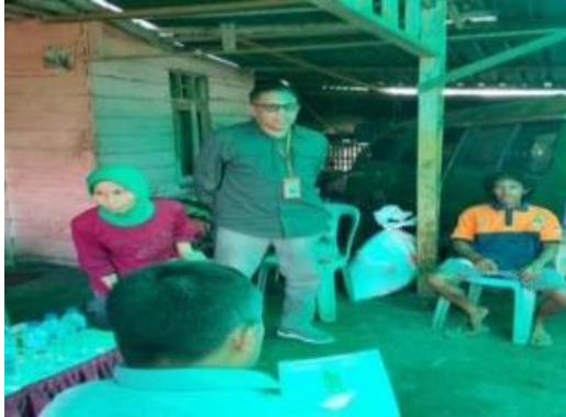
Gambar 3. Pembukaan Kegiatan PDM

bobot badan ternak (Zaeni, 2019). Dijelaskan pula kebutuhan bahan dan peralatan dalam menghasilkan pakan ternak dengan memanfaatkan limbah tebon jagung yang selama ini belum dimanfaatkan secara optimal.