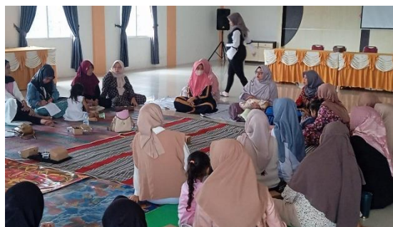
Gambar 2. Dokumentasi kegiatan Penyuluhan

Salah satu Faktor yang mendukung keberhasilan ASI eksklusif adalah Motivasi, dimana motivasi masuk dalam predisposing factors . Motivasi adalah keinginan untuk melakukan sebagai kesediaan untuk mengeluarkan tingkat upaya yang tinggi untuk tujuan-tujuan organisasi, yang dikondisikan oleh kemampuan upaya itu untuk memenuhi suatu kebutuhan individual. (Robbins & Judge, 2023). Motivasi adalah suatu faktor yang mendorong seseorang untuk melakukan suatu aktifitas tertentu, oleh karena itu motivasi sering kali diartikan pula sebagai faktor pendorong perilaku seseorang