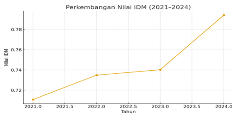
Gambar 1. IDM Desa Sungai Pitung

Desa Sungai Pitung merupakan salah satu desa agraris yang terletak di Kecamatan Alalak, Kabupaten Barito Kuala, sebuah kawasan yang sejak lama dikenal sebagai wilayah pertanian pasang surut. Secara geografis, desa ini dikarakterisasi oleh hamparan sawah yang luas, pola tanam musiman, serta masyarakat yang menggantungkan hidup hampir sepenuhnya pada hasil pertanian, terutama padi. Gambaran ini sebenarnya tidak berbeda jauh dengan mayoritas desa di Kalimantan Selatan, yang hidupnya berputar mengikuti siklus pertanian: mulai dari masa olah lahan, penanaman, hingga panen.