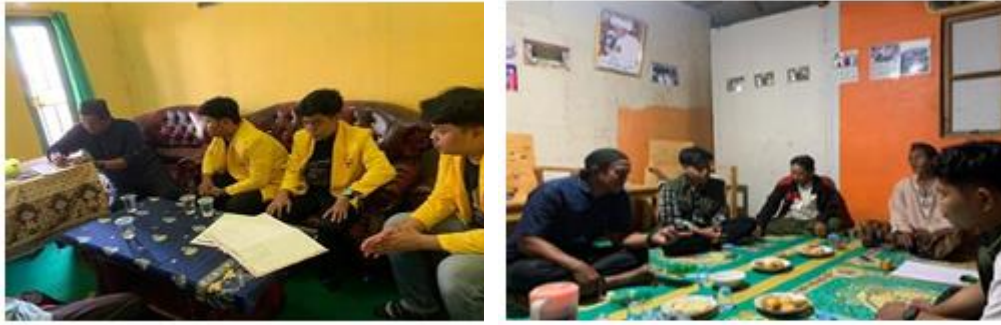
Gambar 3. Diskusi Bersama Kepala Desa dan Warga