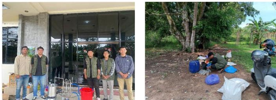
Gambar 4. Instalasi Alat Pirolisis dan Kebun Loofah