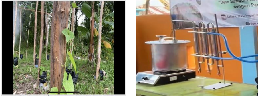
Gambar 6. Alat Pirolisis dan Kebun Loofah

Capaian utama dalam pengolahan limbah pertanian adalah berfungsinya alat pirolisis berbahan stainless steel yang mampu mengubah limbah sekam padi menjadi asap cair. Melalui teknologi ini, sekam padi yang sebelumnya hanya dibakar secara terbuka di pinggir sawah dan menimbulkan polusi udara kini telah bertransformasi menjadi produk dengan nilai guna fungsional. Selain itu, diversifikasi pertanian melalui pembudidayaan tanaman loofah telah berhasil menciptakan aset produktif baru bagi desa. Lahan kosong yang sebelumnya tidak termanfaatkan secara optimal kini telah dikelola menjadi kebun loofah produktif yang dilengkapi dengan sarana pendukung seperti struktur rambatan setinggi 6 meter dan sistem irigasi tetes sederhana. Hasil pemantauan awal menunjukkan bahwa bibit loofah mampu beradaptasi dengan baik pada kondisi tanah setempat meskipun terdapat kendala pada kualitas air sungai yang asam.