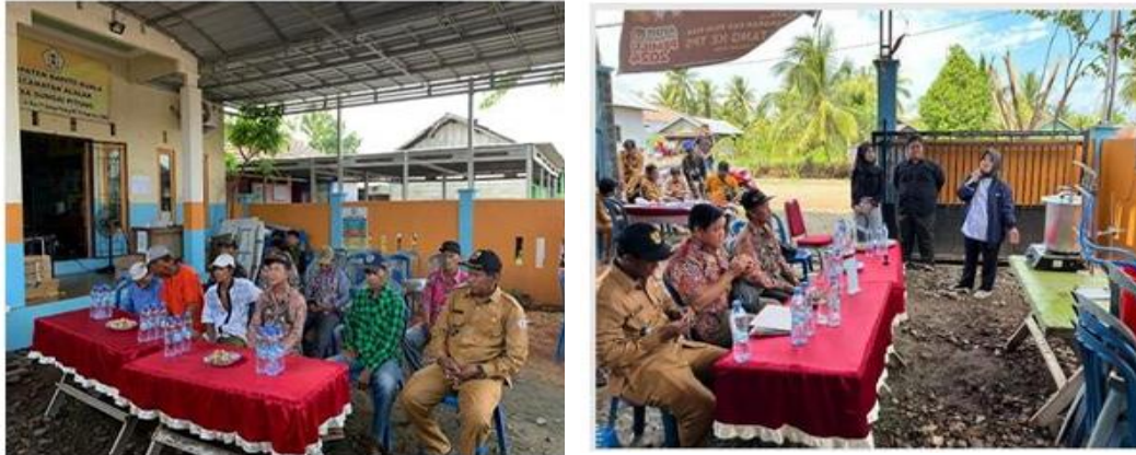
Gambar 5. Sosialisasi Kepada Warga Desa Sungai Pitung

ceramah interaktif, diskusi, dan praktik langsung untuk memastikan transfer pengetahuan dan keterampilan.