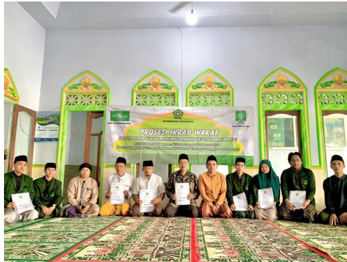
Gambar 3. Pelaksanaan Penyerahan Akta Wakaf

Pengelolaan dan manfaat tanah wakaf masjid Nurul Iman semoga dapat berjalan dengan optimal dan sesuai dengan tujuan wakaf. Adanya wakaf ini, semoga dapat dimanfaatkan dengan semestinya dan manfaatnya dapat dirasakan jangka panjang, tidak hanya dirasakan oleh generasi saat ini, tapi juga dirasakan oleh generasi mendatang.