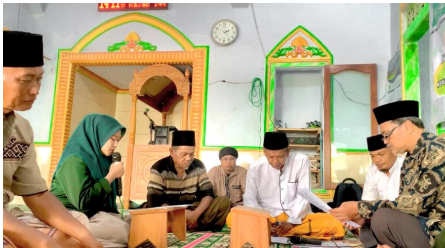
Gambar 2. Pelaksanaan Ikrar Wakaf

Kegiatan pengabdian ini dilaksanakan pada hari jum'at, tanggal 09 Februari 2024 di masjid nurul iman. Kegiatan ini menghasilkan satu ikrar tanah wakaf milik masjid Nurul Iman yang terletak di Dusun Krajan RT/RW 001/001 Desa Ringinsari Sumbermanjing Wetan Kabupaten Malang. ikrar tersebut diikuti oleh Nadzir dari MWCNU Sumbermanjing Wetan, Kepala KUA Sumbermanjing Wetan, dua penyuluh dari KUA Sumbermanjing Wetan, wakif, kepala desa Ringinsari, dan dua saksi.