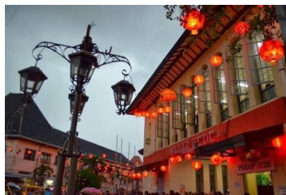
Gambar 7. Glodok Petak 9

Monumen Nasional (Monas) adalah landmark kebanggaan masyarakat Jakarta yang dapat di pilih sebagai tempat untuk hunting foto. Taman di pelataran Monas ini sangat luas sehingga ada banyak pengunjung yang melakukan aktivitas di sana, mulai dari bermain bola, berolahraga, tetapi juga untuk sekedar duduk bersantai.