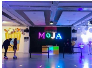
Gambar 16. MoJa Museum

Jakarta Aquarium merupakan theme park adalah suatu wahana dengan beragam biota laut dan juga satwa darat yang jumlahnya kurang lebih 2000 dari 600 jenis satwa endemik Indonesia, di mana para pengunjung dapat bermain bersama dengan satwa darat seperti, kura-kura, kuda laut dan berang-berang. Lokasinya berada di dalam kawasan Neo SOHO, yaitu pusat perbelanjaan di Jakarta Barat tepatnya di lantai LG 101-LGM 101, jalan Letjend S. Parman Kav. 28 (Hasim & Indrawan, 2020).