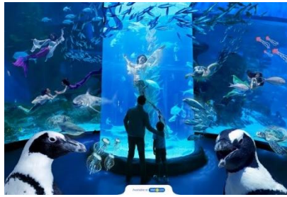
Gambar 15. Jakarta Aquarium

Jakarta Aquarium merupakan theme park adalah suatu wahana dengan beragam biota laut dan juga satwa darat yang jumlahnya kurang lebih 2000 dari 600 jenis satwa endemik Indonesia, di mana para pengunjung dapat bermain bersama dengan satwa darat seperti, kura-kura, kuda laut dan berang-berang. Lokasinya berada di dalam kawasan Neo SOHO, yaitu pusat perbelanjaan di Jakarta Barat tepatnya di lantai LG 101-LGM 101, jalan Letjend S. Parman Kav. 28 (Hasim & Indrawan, 2020).