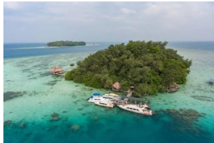
Gambar 10. Kepulauan Seribu

Taman Mini Indonesia Indah merupakan tempat wisata dan juga tempat hunting foto di Jakarta yang sangat menarik untuk dikunjungi. Para pencinta foto bisa memotret sebanyak mungkin di tempat wisata seluas 150 hektar ini.