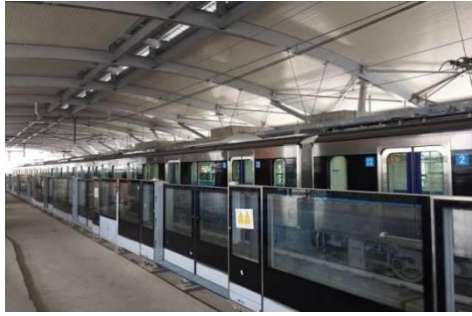
Gambar 12. Stasiun MRT Thamrin

Selanjutnya ada pula spot foto di Jakarta bernuansa urban yang modern, yaitu Stasiun MRT yang berlokasi di kawasan Sudirman-MH Thamrin. Stasiun MRT terbaru di Jakarta satu ini bisa menjadi tempat foto yang menarik. Mengambil foto saat berada di dalam MRT juga bisa memberikan latar belakang foto yang natural dengan konsep candid yang cukup artistik.