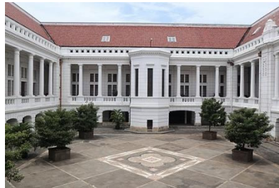
Gambar 4. Meseum Bank Indonesia

Di tengah keramaian Kota Jakarta terdapat hutan mangrove di kawasan Pantai Indah Kapuk yang menawarkan ketenangan sekaligus pemandangan cukup luas untuk berfoto. Tempat hunting foto di Jakarta tersebut didominasi dengan pemandangan hutan dan sungai yang bisa dilewati dengan menggunakan perahu.