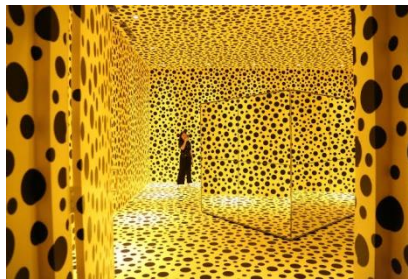
Gambar 14. Museum Macan

Salah satu gedung terkemuka dan bersejarah yang ada di Jakarta adalah Museum Galeri Nasional (Shafarila et al., 2025). Galeri ini berfokus pada seni sehingga dengan mudah menarik perhatian para pecinta seni seperti patung, keramik, lukisan atau fotografi.