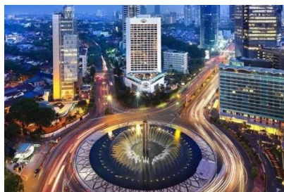
Gambar 5. Bunderan HI

Tidak jauh dari pusat keramaian kota tua terdapat sebuah gedung yang saat ini dikelola sebagai Museum Bank Indonesia. Gedung dengan bangunan jaman kolonial Belanda ini bergaya klasik yang menawarkan suasana vintage tapi tetap menonjolkan sisi romantis.