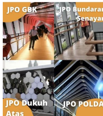
Gambar 11. JPO Kawasan Jendral Sudirman

Warga Jakarta pasti mengenal dan sangat familiar dengan Kepulauan Seribu, di mana tempat wisata ini menjadi salah satu tujuan rekreasi bagi warga Jakarta yang ingin berlibur di pantai. Selain dekat, pemandangan di Kepulauan Seribu juga sangat menarik, dengan banyaknya fotografer yang menyeberang dari Jakarta ke Kepulauan Seribu untuk hunting foto.