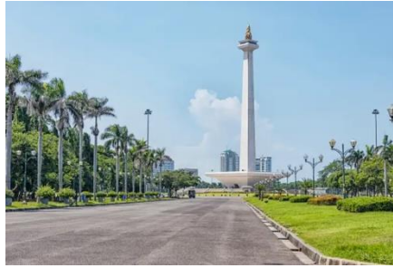
Gambar 6. Monumen Nasional (MONAS)

Monumen Nasional (Monas) adalah landmark kebanggaan masyarakat Jakarta yang dapat di pilih sebagai tempat untuk hunting foto. Taman di pelataran Monas ini sangat luas sehingga ada banyak pengunjung yang melakukan aktivitas di sana, mulai dari bermain bola, berolahraga, tetapi juga untuk sekedar duduk bersantai.