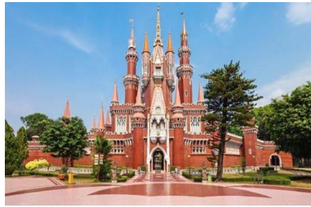
Gambar 9. Taman Mini Indonesia Indah

Taman Mini Indonesia Indah merupakan tempat wisata dan juga tempat hunting foto di Jakarta yang sangat menarik untuk dikunjungi. Para pencinta foto bisa memotret sebanyak mungkin di tempat wisata seluas 150 hektar ini.