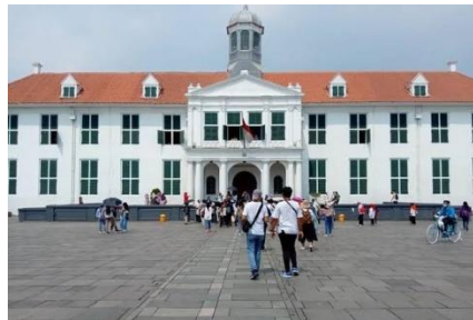
Gambar 1. Kota Tua

Berikut ini adalah beberapa tempat wisata di Jakarta yang sering dikunjungi oleh para fotografer dan masyarakat pencinta fotografi, di mana mereka dapat mengeksplorasi obyek-obyek atau spot foto yang menarik, modern dan memiliki nilai historis di antaranya: