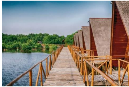
Gambar 3. Hutan Magrove PIK

Kawasan seputar Museum Taman Prasasti dikenal sebagai tempat yang historis di Jakarta. Oleh sebab itu banyak fotografer yang membawa modelnya untuk pengambilan gambar/ shoot foto di sini.