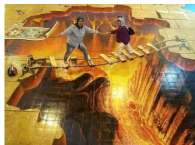
Gambar 17. Magic Art 3D Museum

Sebagai tempat seni interaktif dekat Pondok Indah Mall , MoJa Museum memiliki atraksi berupa ruangan dengan tema sinematik dari film-film berkelas. Memiliki tak kurang dari 14 ruangan yang bisa dijadikan sebagai spot foto, MoJa Museum menjamin pengalaman berfoto yang tidak bisa diberikan oleh museum lainnya. Museum ini menjalankan sistem 1 way trip (Mutia & Kristina, 2019). Artinya, pengunjung tidak boleh kembali ke ruangan seni yang telah dilewati. Oleh karena itu, jika pengunjung telah berfoto di satu ruangan dapat beranjak ke ruang seni selanjutnya.