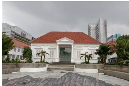
Gambar 13. Galeri Nasional Indonesia

Selanjutnya ada pula spot foto di Jakarta bernuansa urban yang modern, yaitu Stasiun MRT yang berlokasi di kawasan Sudirman-MH Thamrin. Stasiun MRT terbaru di Jakarta satu ini bisa menjadi tempat foto yang menarik. Mengambil foto saat berada di dalam MRT juga bisa memberikan latar belakang foto yang natural dengan konsep candid yang cukup artistik.