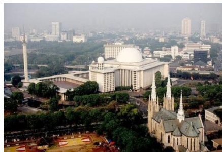
Gambar 8. Masjid Istiqlal dan Gereja Katedral

Kawasan pecinan di Jakarta akan memberikan warna tersendiri untuk setiap foto yang di hasilkan. Petak 9 Glodok adalah kawasan pecinan di Jakarta yang terdapat berbagai bangunan ala negeri tirai bambu. Bangunan rumah maupun klenteng yang terdapat di kawasan ini seolah-olah sedang berada di Tiongkok.