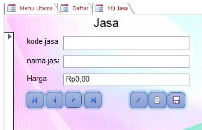
Gambar 5. Daftar Jasa.