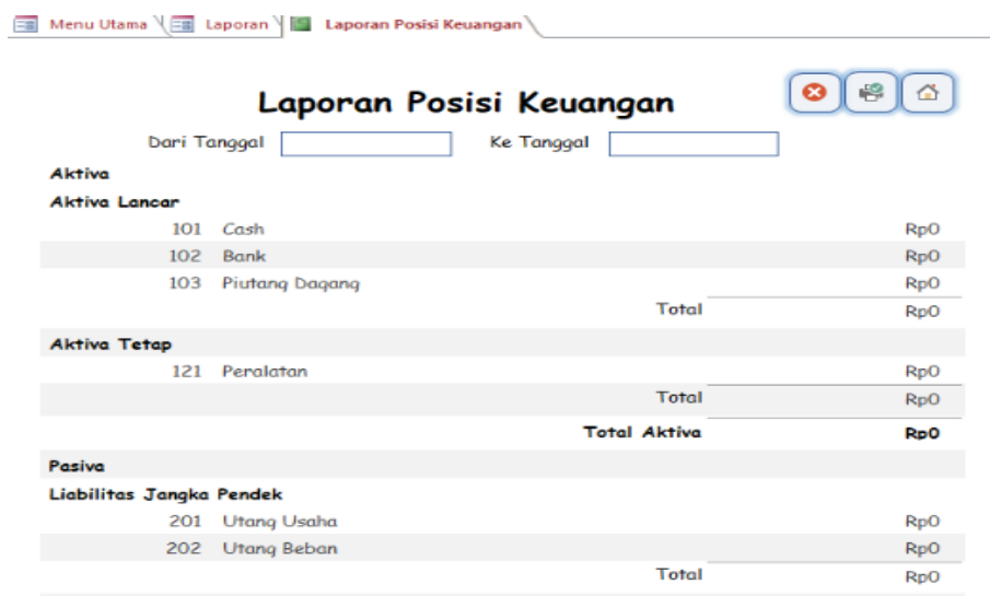
Gambar 11. Laporan Posisi Keuangan.

Laporan posisi keuangan menyajikan situasi keuangan perusahaan pada akhir periode tertentu. Laporan ini menyajikan informasi tentang aset, liabilitas, dan ekuitas perusahaan. Aset mencerminkan sumber daya yang dimiliki, sedangkan liabilitas menunjukkan kewajiban kepada pihak ketiga, dan ekuitas menggambarkan hak kepemilikan pemilik usaha. Melalui laporan ini, perusahaan dapat menilai struktur keuangannya serta kemampuan untuk melunasi kewajiban periode waktu jangka pendek dan panjang (Gie, 2020). Rancangan laporan posisi keuangan dapat ditampilkan Gambar 11.