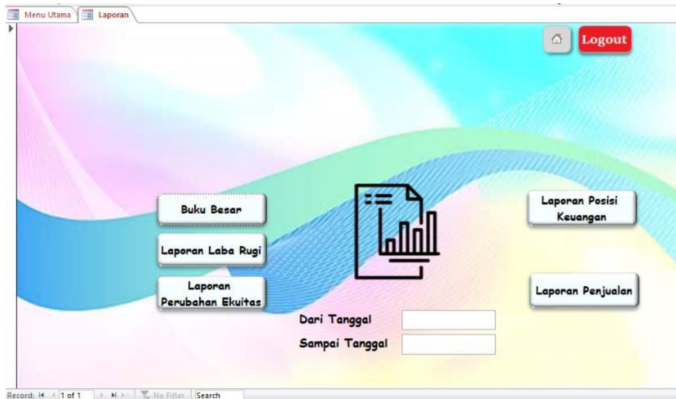
Gambar 3. Menu Laporan.

Berisi kumpulan form untuk menampilkan berbagai laporan keuangan. Rancangan menu laporan ditampilkan pada Gambar 3.