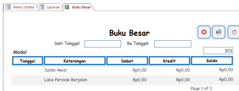
Gambar 8. Buku Besar.

Buku besar merupakan kumpulan dari seluruh transaksi keuangan yang telah dicatat dalam periode tertentu. Buku ini berfungsi sebagai dasar untuk menilai dan memantau perubahan pada aset, liabilitas, serta ekuitas perusahaan yang terjadi akibat berbagai aktivitas bisnis. Perubahan tersebut dapat disebabkan oleh beragam faktor, seperti karakteristik usaha, kondisi keuangan, maupun besarnya volume transaksi yang dilakukan perusahaan. Dalam buku besar, akun diklasifikasikan menjadi akun riil dan akun nominal. Akun riil mencakup elemen-elemen pada laporan posisi keuangan, sementara akun nominal terdiri dari akun-akun pada laporan laba rugi (Gie, 2020). Rancangan buku besar ditampilkan pada Gambar 8.