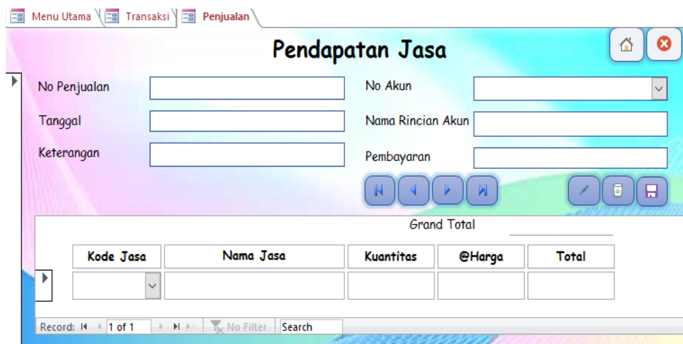
Gambar 7. Penjualan. Sumber: Data diolah (2025)

Berfungsi mencatat transaksi penjualan jasa secara harian agar seluruh aktivitas penjualan terdokumentasi secara sistematis. Rancangan penjualan ditampilkan pada Gambar 7.