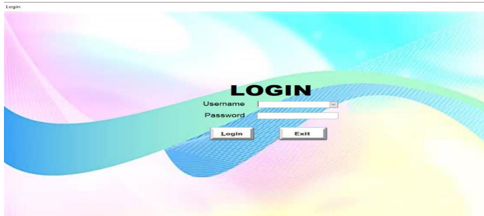
Gambar 1. Menu Login . Sumber: Data diolah (2025)

Menu ini memiliki fungsi menjaga keamanan informasi keuangan perusahaan. Hanya pengguna dengan nama dan kata sandi yang terdaftar yang dapat mengakses sistem. Rancangan menu login ditampilkan pada Gambar 1.