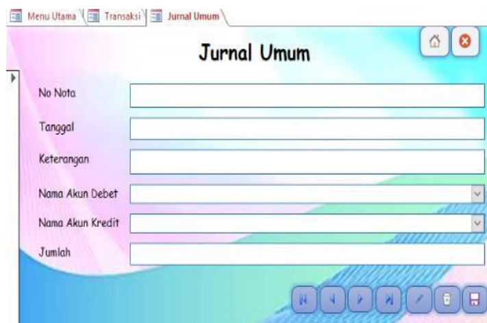
Gambar 6. Jurnal Umum.

Fitur untuk mencatat transaksi selain penjualan dan pembelian, dengan kolom nomor transaksi, tanggal, deskripsi, akun, serta nilai debit dan kredit. Rancangan jurnal umum ditampilkan pada Gambar 6.