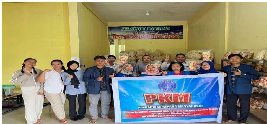
Gambar 5. Sosialisasi, Tema "Peningkatan Kinerja Umkm Melalui Pelatihan Manajemen Sumber Daya Manusia Berbasis Kompetensi di Desa Suka Maju Kecamatan Sunggal Kabupaten Deli Serdang