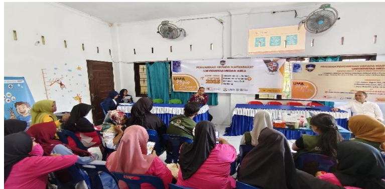
Gambar 2. Pengabdian kepada masyarakat di Desa Suka Maju Kecamatan Sunggal

Pengabdian kepada masyarakat ini merupakan usaha untuk menyebarkan ilmu pengetahuan, teknologi, dan seni kepada masyarakat. Kegiatan tersebut harus mampu memberikan suatu nilai tambah bagi masyarakat. Kegiatan pengabdian ini sudah dilaksanakan pada hari 31 oktober sampai dengan 1 Nopember 2025 dimana Pengabdian masyarakat mengangkat tema peningkatan kinerja UMKM melalui pelatihan manajemen sumber daya manusia berbasis kompetensi di desa suka maju kecamatan sunggal kabupaten deli serdang.