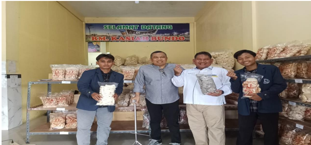
Gambar 4. kekompakan team dosen dan mahasiswa dalam Pengabdian masyarakat