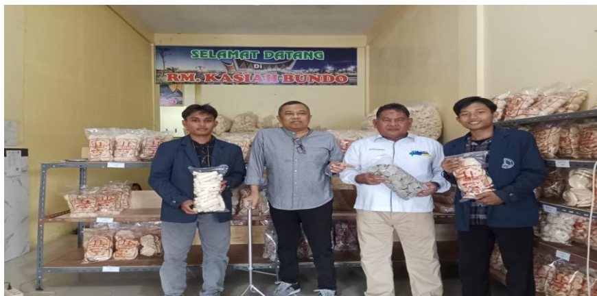
Gambar 3. Beberapa produk UMKM di Desa Suka Maju Kecamatan Sunggal Kabupaten Deli Serdang

Monitoring dilakukan untuk menilai sejauh mana UMKM telah mengadopsi dan menerapkan prinsip-prinsip manajemen SDM berbasis ekonomi kreatif. Tim pengabdian memantau perubahan dalam struktur kerja, produktivitas, dan kinerja tim UMKM. Evaluasi dilakukan dengan menggunakan kuesioner dan wawancara untuk mengukur keberhasilan program serta memberikan umpan balik bagi peserta dan penyelenggara kegiatan. Kegiatan diakhiri dengan penyusunan laporan yang mencakup hasil, dampak, dan rekomendasi dari program. Laporan ini dirancang untuk memberikan gambaran menyeluruh tentang pencapaian kegiatan dan potensi pengembangannya di masa depan. Selain itu, rekomendasi juga disusun untuk memberikan panduan kepada pihak-pihak terkait dalam mendukung keberlanjutan pengembangan UMKM di Desa Suka Maju Kecamatan Sunggal Kabupaten Deli Serdang.