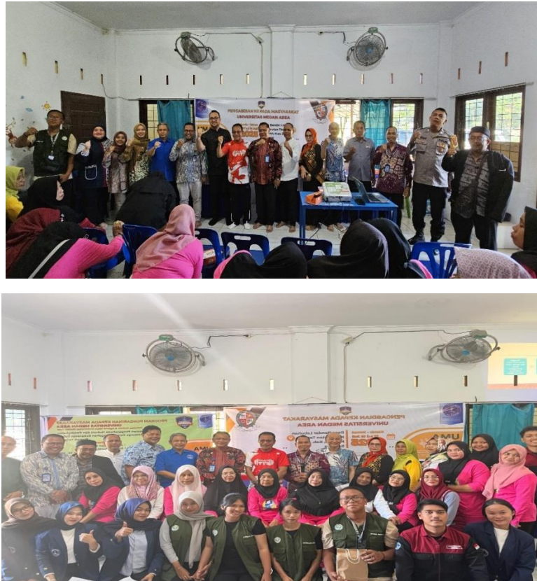
Gambar 5. Foto Bersama Dosen Kegiatan PKM dengan Perangkat Desa Bandar Labuhan SIMPULAN

hukum. Masyarakat tidak hanya dilibatkan sebagai objek, tetapi juga sebagai subjek aktif yang berdaya dalam membangun budaya digital yang sehat dan bebas dari kekerasan seksual. Dengan demikian, upaya pencegahan dapat berjalan lebih efektif, berkelanjutan, dan berdampak nyata dalam kehidupan sehari-hari.