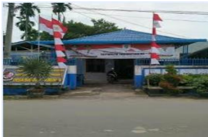
Gambar 1. Kantor Desa Bandar Labuhan Kecamatan Tanjung Morawa

Keterlibatan keluarga dalam edukasi dan perlindungan anak sangat dibutuhkan untuk mencegah penyalahgunaan zat berbahaya ini (Nasution et al., 2020).