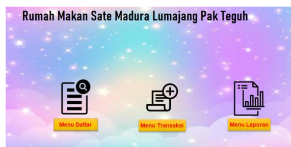
Gambar 2. Menu Utama

Pada rancangan ini terdapat beberapa tabel utama, yaitu Daftar Akun, Pelanggan, Pemasok, Persediaan, Penjualan, Pembelian, Rincian Penjualan, Rincian Pembelian, Jurnal Umum, serta Tipe Akun. Masing-masing tabel memiliki fungsi dan keterkaitan tersendiri dalam mendukung sistem pencatatan keuangan.