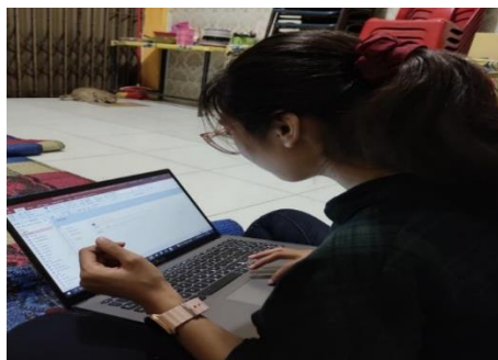
Gambar 14. Implementasi Pelatihan Sistem Ms. Access

Laporan Pembelian menampilkan seluruh data transaksi pembelian dalam periode tertentu. Komponen yang terdapat pada laporan ini terdiri dari Nomor Pembelian, Tanggal Pembelian, Keterangan, Nama Persediaan, Kuantitas, Harga satuan, dan Total. Setiap transaksi yang dimasukkan melalui form pembelian akan otomatis tercatat dan tersusun dalam laporan ini, sehingga proses pelacakan pembelian menjadi lebih mudah dan akurat. Fungsi utama laporan ini adalah untuk membantu pemilik usaha memantau jumlah barang yang dibeli, nilai total pengeluaran yang dikeluarkan untuk pembelian, serta memastikan bahwa seluruh transaksi pembelian telah tercatat dengan benar.