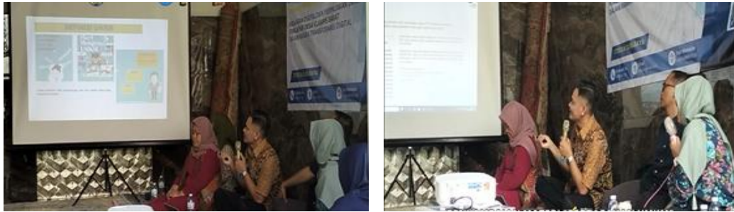
Gambar 3. Pelatihan Materi Pengetahuan Perpajakan UMKM

kewajibannya dalam aspek perpajakan UMKM. Sebagai contoh, para pelaku usaha hanya dikenai kewajiban untuk penyetoran kepada negara jika telah memenuhi omset di atas nominal Rp 500.000.000,00 setahun. Jika belum memenuhinya, maka hanya dikenai kewajiban pelaporan saja.