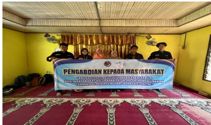
Gambar 2. Foto bersama dengan Mitra PKM

Pada Pada pelaksanaan pengabdian, Pendamping PKH dan peserta PKM sangat mendukung di kegiatan edukasi perilaku CTPS. Adapun bentuk dukungan adalah sebagai berikut: