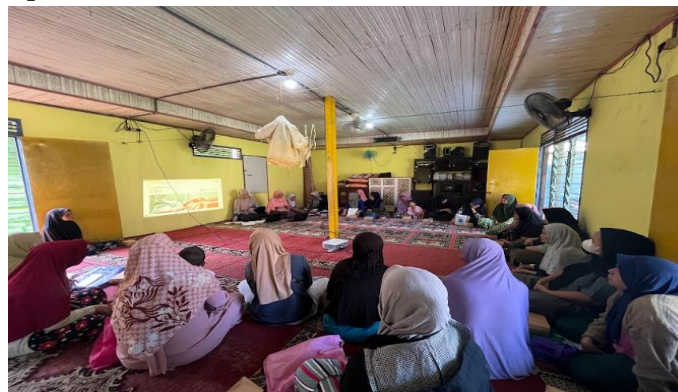
Gambar 3. Antusiasme Peserta PKM dalam mengikuti kegiatan