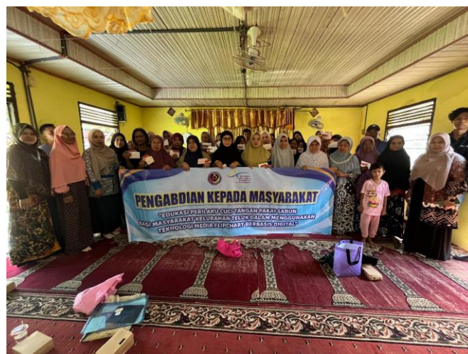
Gambar 4. Photo Bersama dengan Pendamping PKH dan Peserta PKM