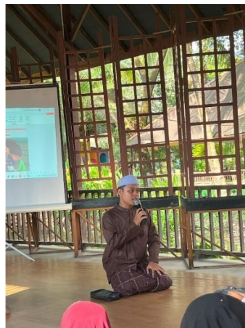
Gambar 4. berdoa bersama sebelum kegiatan pengabdian

Partisipasi masyarakat dalam kegiatan ini menunjukkan keterlibatan yang aktif dan kolaboratif. Kehadiran 30 santri/wati, 3 ustaz/ustazah, dan 1 perwakilan yayasan mencerminkan komitmen kuat dari pihak Rumah Tahfidz Al-Hasan Pawon Tlogo dalam mendukung kegiatan edukatif yang bertujuan meningkatkan kualitas adab membaca Al-Qur'an. Para ustaz/ustazah tidak hanya hadir sebagai pendamping, tetapi juga berperan sebagai fasilitator dalam sesi diskusi dan refleksi setelah pemutaran animasi.