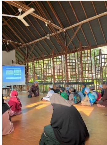
Gambar 5. Ustaz sedang mengarahkan fokus santri/santriwati

Pelibatan masyarakat tidak terbatas pada kehadiran fisik, tetapi juga mencakup dukungan moral dan logistik. Yayasan menyediakan ruang kegiatan yang nyaman, serta perangkat multimedia yang diperlukan untuk pemutaran animasi. Interaksi antara santri dan fasilitator berlangsung secara dinamis, menunjukkan bahwa pendekatan visual melalui animasi mampu membangun keterlibatan emosional dan intelektual peserta. Kegiatan ini juga membuka ruang dialog antara santri dan pendidik, memperkuat nilai-nilai adab yang diajarkan melalui media digital.