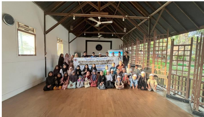
Gambar 2. Foto bersama tim pengabdian, peserta pengabdian, yayasan, dan Ustaz/Ustazah Rumah Tahfidz Al-Hasan Pawon Tlogo

Jumlah peserta yang hadir terdiri dari 30 orang santri/wati, yang merupakan anak-anak penghafal Al-Qur'an dari berbagai jenjang usia, serta didampingi oleh 3 orang Ustaz/Ustazah dan 1 perwakilan dari pihak yayasan. Kehadiran para pendidik dan pengelola yayasan memberikan dukungan moral dan teknis yang sangat berarti dalam kelancaran pelaksanaan kegiatan.