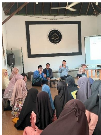
Gambar 6. keterlibatan peserta pengabdian saat proses edukasi

Rumah Tahfidz Al-Hasan Pawon Tlogo sebagai mitra kegiatan menunjukkan pencapaian yang signifikan dalam aspek pemahaman dan internalisasi nilai adab membaca Al-Qur'an. Berdasarkan observasi selama kegiatan, santri mampu mengidentifikasi dan menyebutkan adab-adab utama seperti menjaga kebersihan, memperbaiki niat, membaca dengan tartil, serta menutup mushaf dengan hormat setelah selesai membaca.