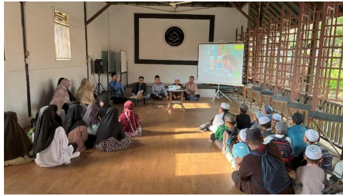
Gambar 3. Penyampaian materi pengabdian

Keberhasilan pelaksanaan kegiatan ini ditunjang oleh beberapa faktor utama. Pertama, antusiasme tinggi dari para santri/wati, yang terlihat dari partisipasi aktif mereka selama sesi berlangsung, baik dalam menyimak tayangan animasi maupun dalam sesi tanya jawab. Kedua, dukungan penuh dari pihak Rumah Tahfidz, baik dari segi fasilitas, waktu, maupun pendampingan langsung oleh para ustaz/ustazah. Ketiga, kesesuaian media dengan karakter peserta, di mana pendekatan visual terbukti lebih efektif dibandingkan metode ceramah konvensional dalam menyampaikan nilai-nilai adab kepada anak-anak.